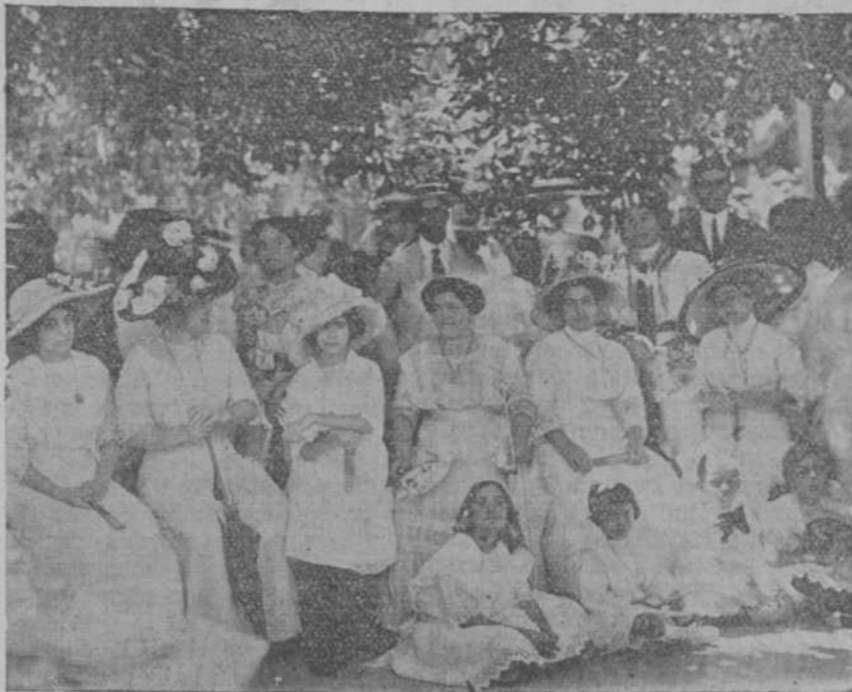
DAMAS Y DAMITAS QUE ASISTIERON A LA JURA