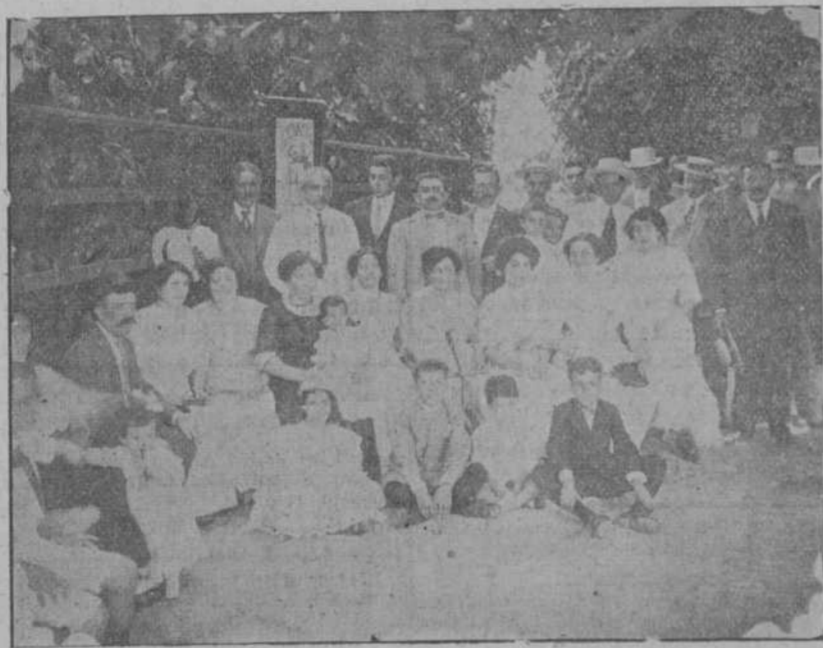
GRUPO DE ROMEROS