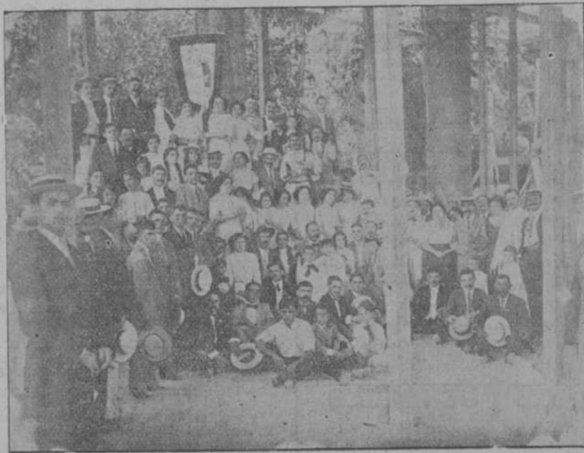
OTRO GRUPO DE ROMEROS

insulares, y que rechazarán toda otra solución en sentido divisionario.