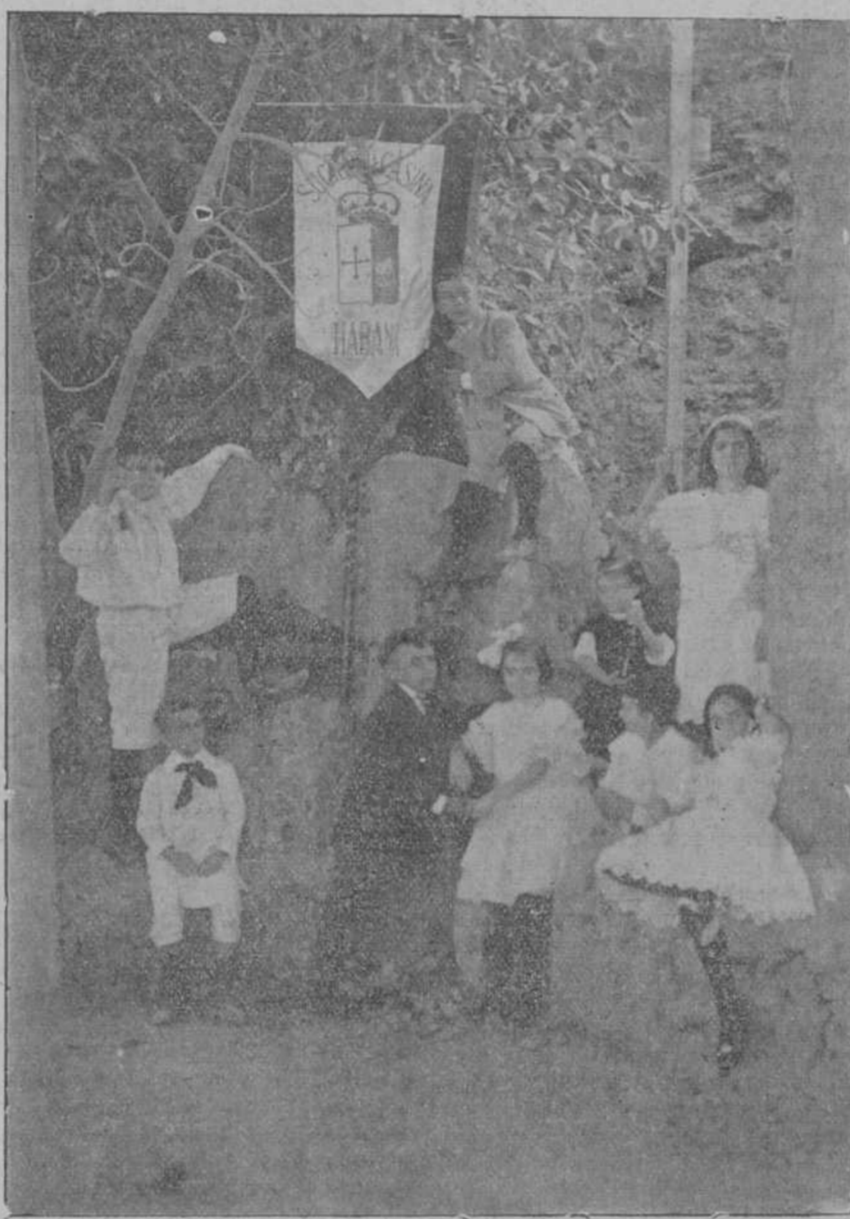
NIÑOS Y NIÑAS BAJO EL ESTANDARTE

Los tinerfeños rechazan toda fórmula conciliadora: dicen que se atienen al programa autonómico de sus Asambleas, al planteamiento de los cabildos