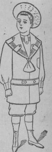
NO PIERDAN TIEMPO Trajecito forma Rusa, de casimír fino; hay para todas las edades, con los pantalones Rectos ó Bombaches. Su precio: $2-50 plata. Y de este precio en adelante, tenemos preciosidades.

Antes de hacer sus compras no dejen de visitar los Grandes Almacenes de Tejidos, Sedería, Perfumería, Confecciones, Trajes para Niño de LA GLORIETA CUBANA, donde hallarán el surtido más completo en Trajes para Niño y en Abrigos para Señoras y Niñas.