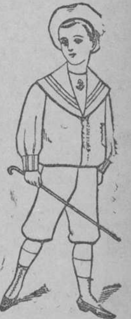
¡QUE OCASION! Trajecito forma Marinera, de casimír fino, para todas las edades, á $3-00 plata.