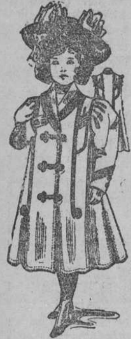
EL FRIO SE APROXIMA

Trajecitos forma americana cruzada, para niños de 8 á 15 años, á $3-50 plata. Su calidad es casimír fino, y los pantalones bombaches.