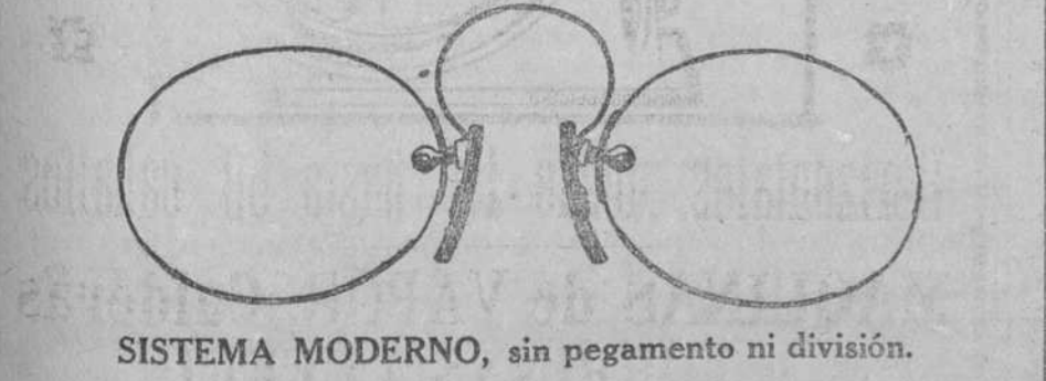
SISTEMA MODERNO, sin pegamento ni división.

Ver de cerca y ver de lejos con un solo espejuelo. Algo nuevo, algo perfecto, algo elegante, algo que NO MOLESTA CRISTALES CON DOS VISTAS