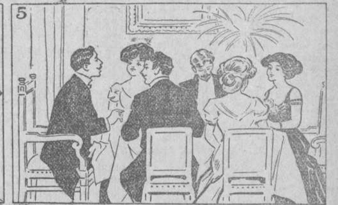
Ante el mundo se elucida. La comedia de la vida.