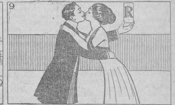
Vienen, la paz á sellar. Las Pastillas de Richards.