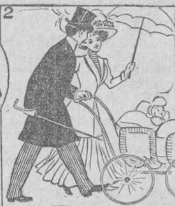
Y el cielo premia su unión. Con fruto de bendición.