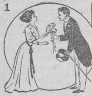
Esta niña y su galán. En el quinto cielo están.