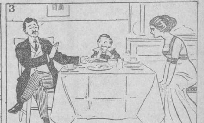
Con las malas digestiones. Entran las perturbaciones.