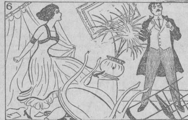
Pero con la reacción. Estalla fiero el ciclón.