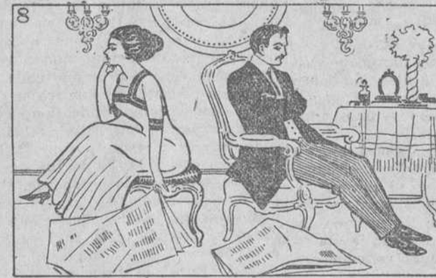
Esta no es paz, sino tregua. Lo cual resalta á la legua.