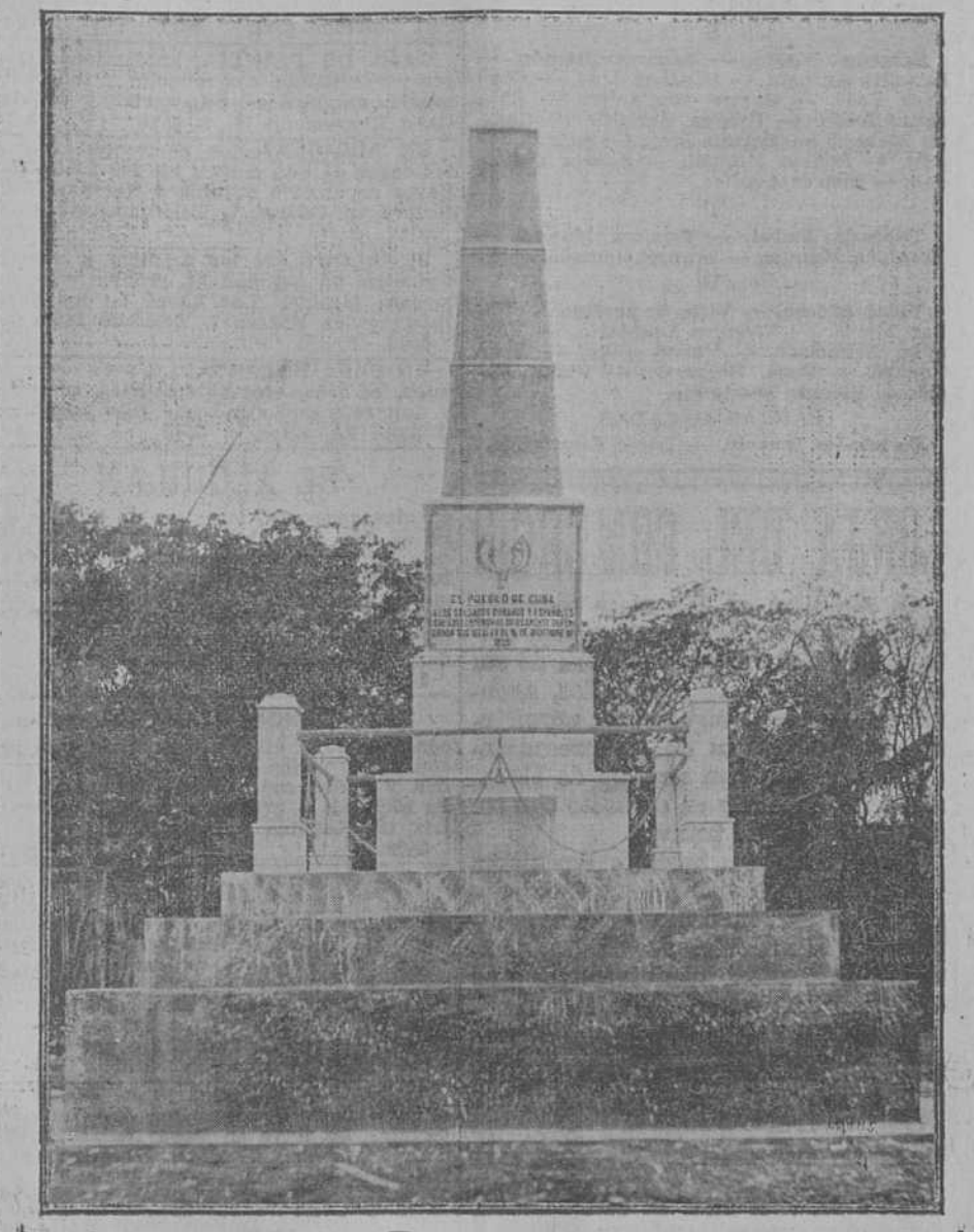
EL OBELISCO DE MALTIEMPO, visto de frente.

El unir, señores, derramada entre miembros de una misma familia, sirviendo tal vez para que otros pueblos que en nada nos son ajenos, hayan honrado la suya... Mas, por fortuna, los hombres podrán hacer cambiar la forma de un gobierno, podrán arriar una bandera pero