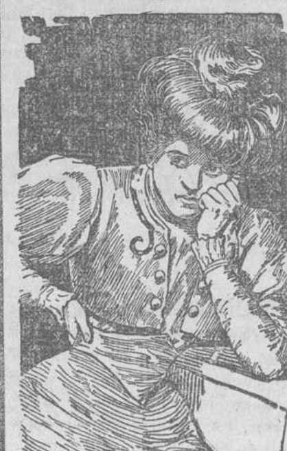
"Cada Cuadro Habla por Si."

Millares de mujeres de todas edades y condiciones sucumben y son víctimas de un penoso estado de postración debido á que tienen afectados los riñones y no lo saben. Se consume la vitalidad, se destruyen los nervios y se hacen imposibles el descanso, sueño y desempeño de los quehaceres domésticos.