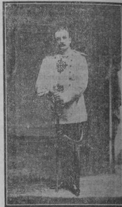
Los Duques de Medina de Rioseco

Entre los primeros aristócratas que llegaron á Melilla, figuran los duques de Medina de Rioseco, noble pareja que se ha consagrado por completo á la campaña, él como soldado voluntario; ella para atender á los heridos.