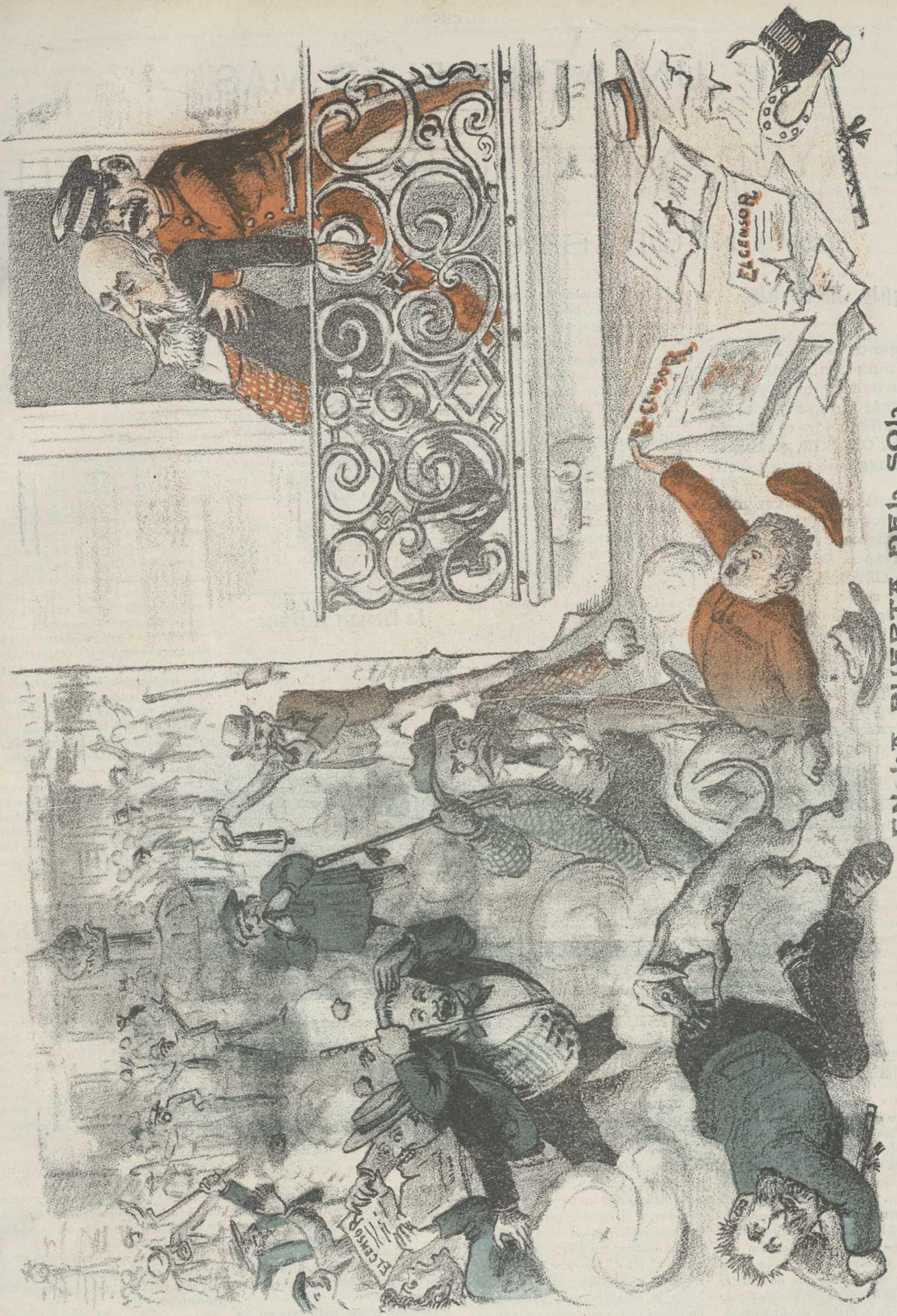
EN LA PUERTA DEL SOL