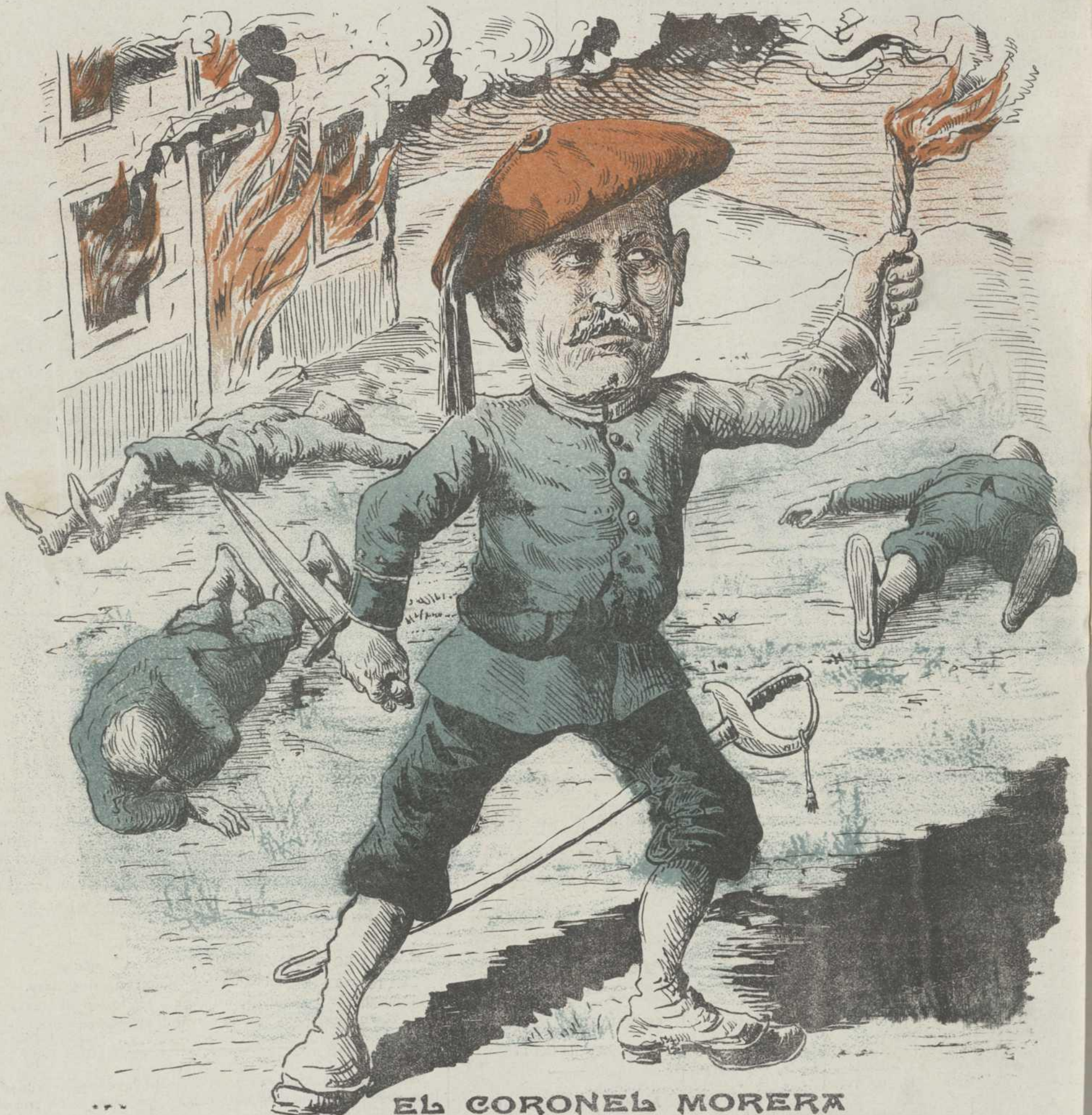
EL CORONEL MORERA

Ayudante del bandido Savalls, asesino de los Carabineros de Olot.