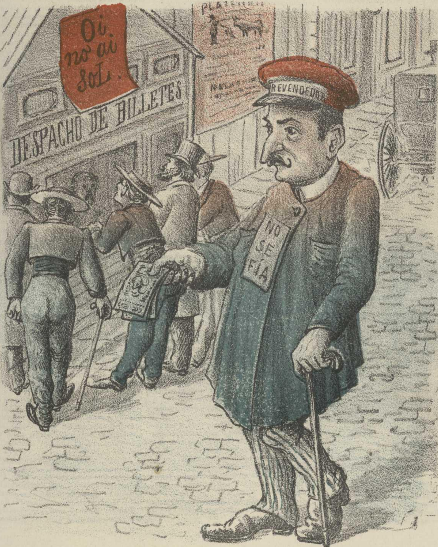
El revendedor.—'Tendidos gratis à 50 pesetas.'