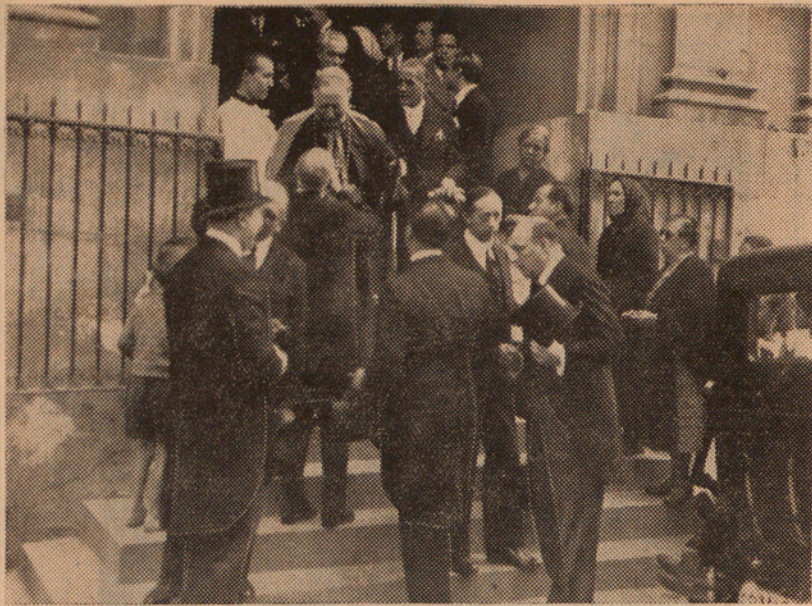
A l'església de Sant Lluís dels francesos, s'han celebrat solemnes funerals per l'ànima del gran polític francès M. Barthou, assassinat en l'atemptat contra el rei de Iugoslàvia. El Nunci de Sa Santedat i altres diplomàtics estrangers sortint dels solemnes oficis.