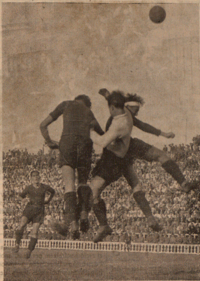
El Barcelona i l'Espanyol s'ha enfrontat per primera vegada aquesta temporada, vencent el Barcelona que demostrà estar en perfecta forma. Els davanters del «Barcelona en lluita «aèria» amb el porter de l'Espanyol.