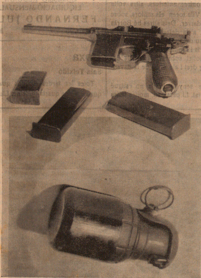
Revòlver amb els carregadors emplets per l'assassí Kalegen en l'atemptat contra el rei de Iugoslàvia. A baix: Bomba de mà trobada a l'assassí.