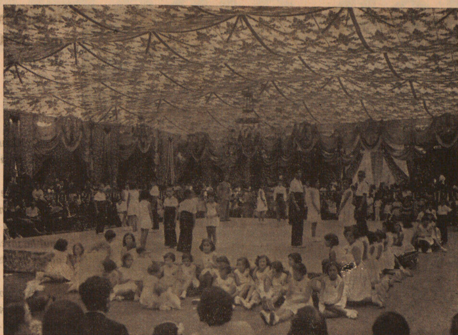
La festa major de la Barceloneta