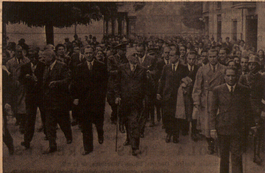
El president de la República, senyor Alcalà Zamora, acompanyat del ministre de la Guerra i de les autoritats, a la seva arribada a Astorga.