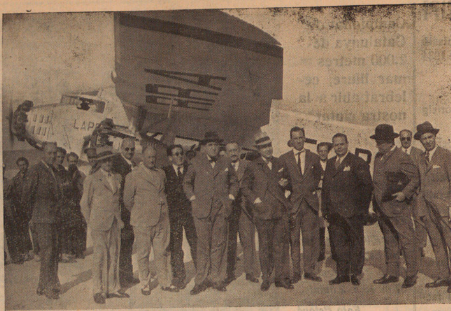
Inauguració de la nova línia aèria Madrid-València

El Sabadell pressionà bastant a la primera part. Serra marcà el primer gol d'un xut fort i col·locadíssim que feu inútil l'intervenció de Florenza. Esteve, burlant primer a Vila i després a