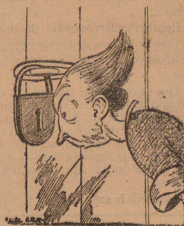
La minyona distreta.

El Sr. Monserrat va dir que enterat de que l'expedient referent a calefacció central en l'Asil de St. Josep no s'havia tramitat en la forma deguda tota vegada que per la Comissió Permanent se havia acordat la celebració del oportú concurs i que passés l'assumpte a la Comissió de Foment per redactar les condicions econòmiques i facultatives oportunes lo que no s'ha efectuat i resultant per tant que l'acord prè en l'últ-