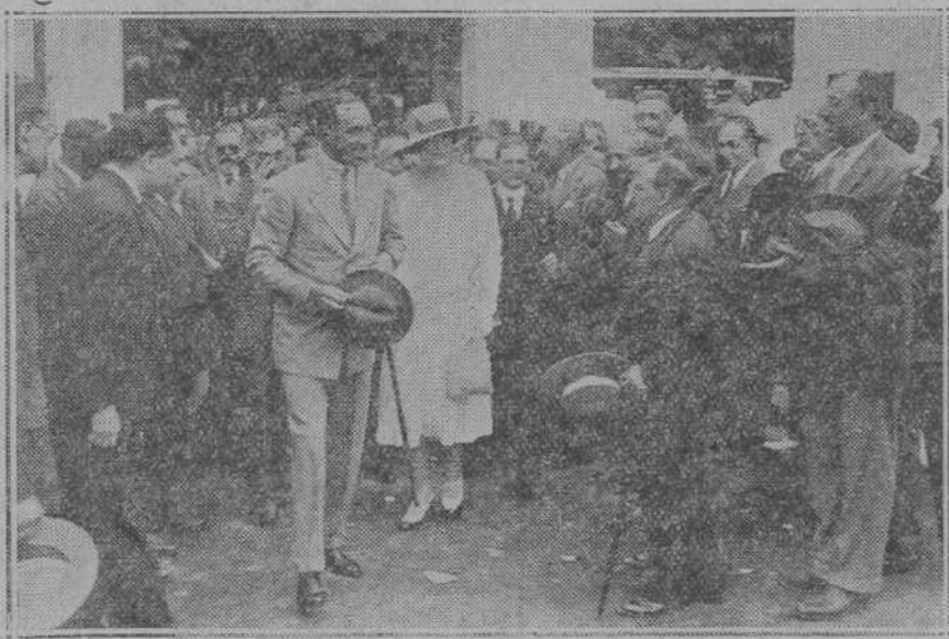
LOS REYES EN TORRELAVEGA.—Sus Majestades entrando en los locales en que está instalado el Concurso de ganados.

A mi vuelta a Marruecos propondré la repatriación de fuerzas, en total, por ahora, de unas veinte compañías expedicionarias, y sucesivamente las demás, hasta que no queden en Africa más que las fuerzas de la guarnición en la zona y cuyo sostenimiento figura entre otras cargas en el presupuesto de Marruecos.