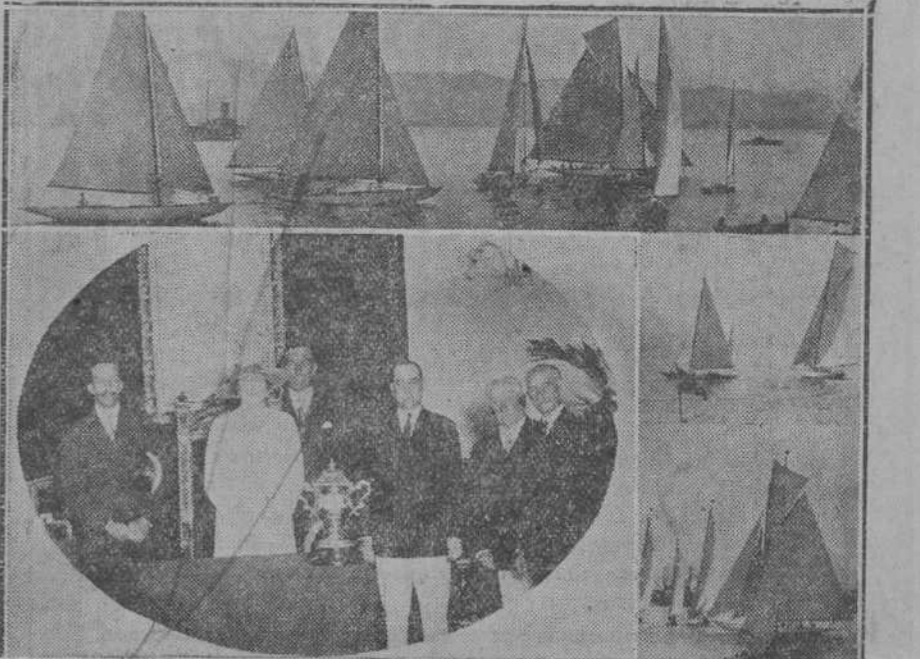
Sus Majestades los Reyes presidiendo el acto del reparto de premios de las regatas, recientemente celebradas.