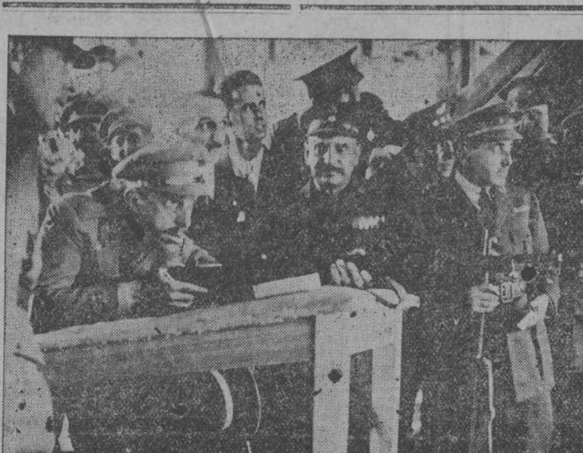
EN EL TIRO NACIONAL... ov tirando en el nuevo campo, con ocasión de la visita que el So... vano hizo ayer al Peñón.

Nada tan trágicamente ameno, como las memorias del médico de cabecera de la infortunada princesa de Lamballe. La íntima amiga de María Antonieta, arrastrada por las calles de París, cuando la fiebre revolucionaria, era muy digna de haber merecido el indulto de Friné, por la belleza y finura de su entis y por sus magníficos cabellos ondulados, como solo los riza y ondulaba hoy la sorprendente loción «Ondulax». Un cuarto de litro, 3,30. Fabricado por Floralia, creadora del supermo Jabón «Flores del Campo».