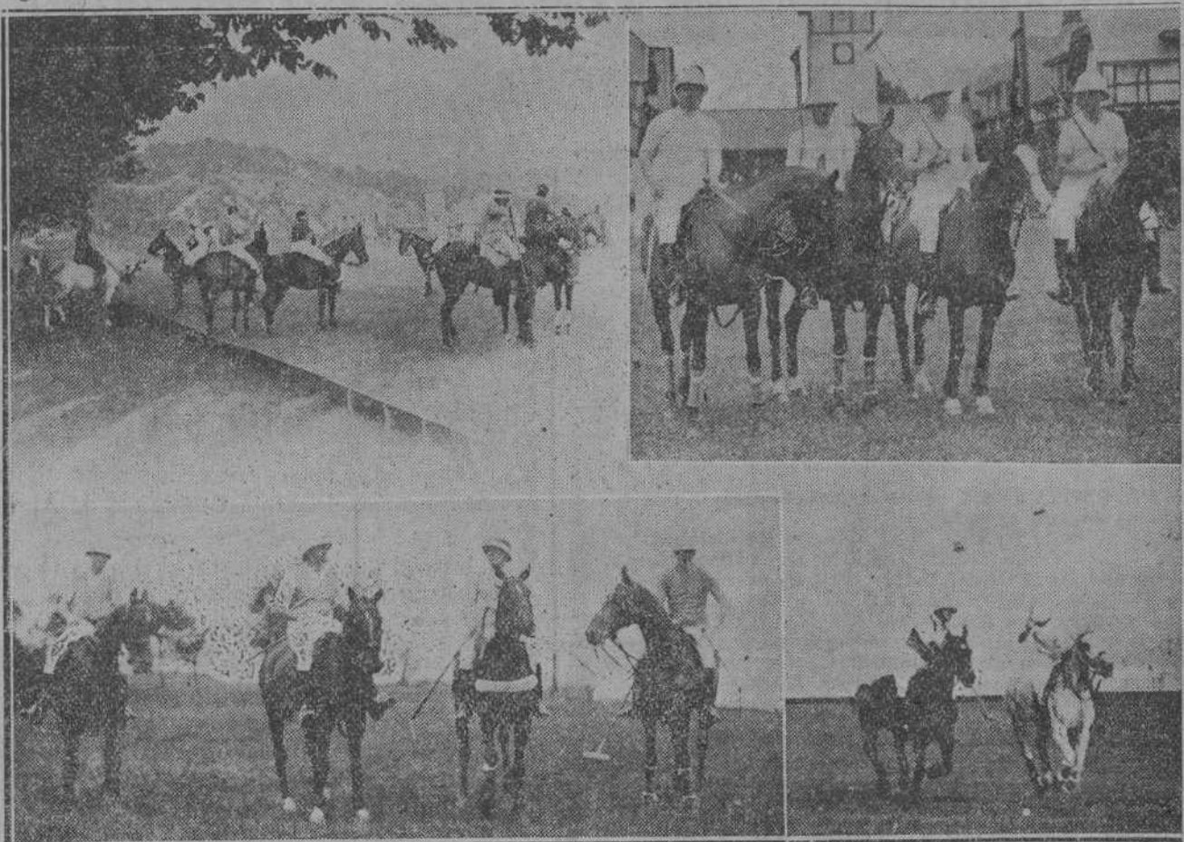
DEL PARTIDO DE POLO DE AYER.—Un saque de «out».—El equipo blanco, ganador del partido.—El equipo morado.—Una interesante jugada.

MADRID, 3.—El director general de Marruecos y Colonias ha facilitado una nota, en la que hace saber a todas aquellas personas que desde diferentes regiones se dirigen en demanda de informes de asuntos relacionados con el Africa Occidental, que deben dirigirse al negociado informativo establecido en el Gobierno general de Santa Isabel (Fernando Pío) y a la sección local de asuntos generales, donde serán convenientemente informados en cuanto deseen.