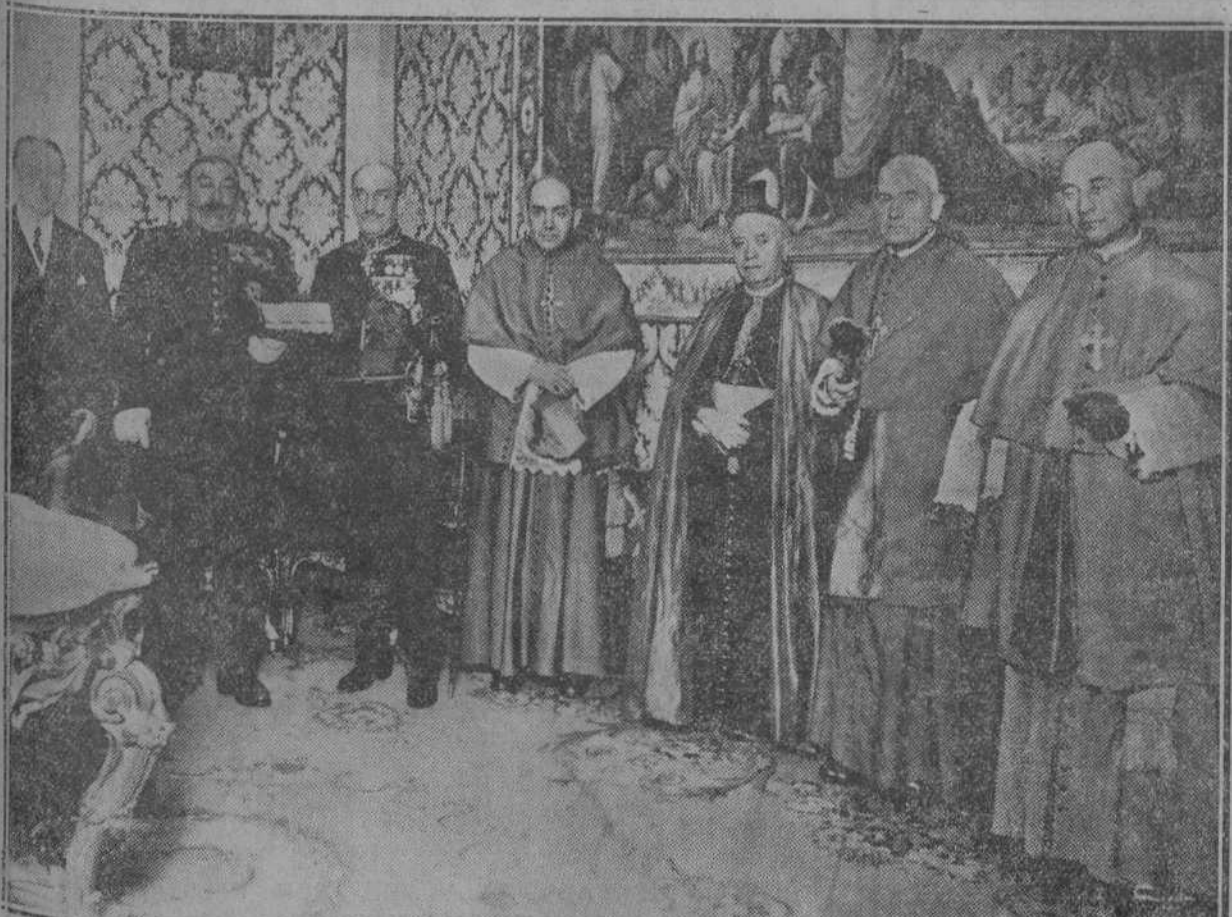
En la presidencia civil y militar; arzobispo de Burgos y obispos de Calahorra, Palencia y León con sus señores rector y vicario del doctor Plaza García.

«Madrid.—Siento muchísimo, fallecimiento señor obispo, y envío mi pésame al Cabildo, dignidades y familia.»