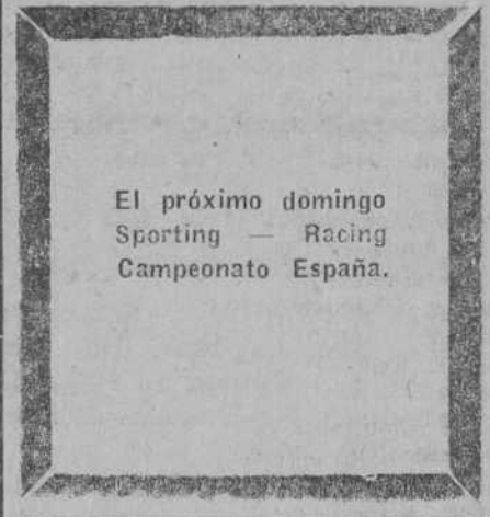
El próximo domingo Sporting — Racing Campeonato España.

Esto debe congratular a los aficionados montañeses. Las mejores tardes del Racing fueron siempre aquellas en las que luchó con temibles adversarios. Recuerdese a este respecto lo ocurrido la temporada anterior con los fronterizos, que en media hora fueron batidos por el Racing en una actuación soberanísima, que sorprendió enormemente a las huestes de Gamborena.