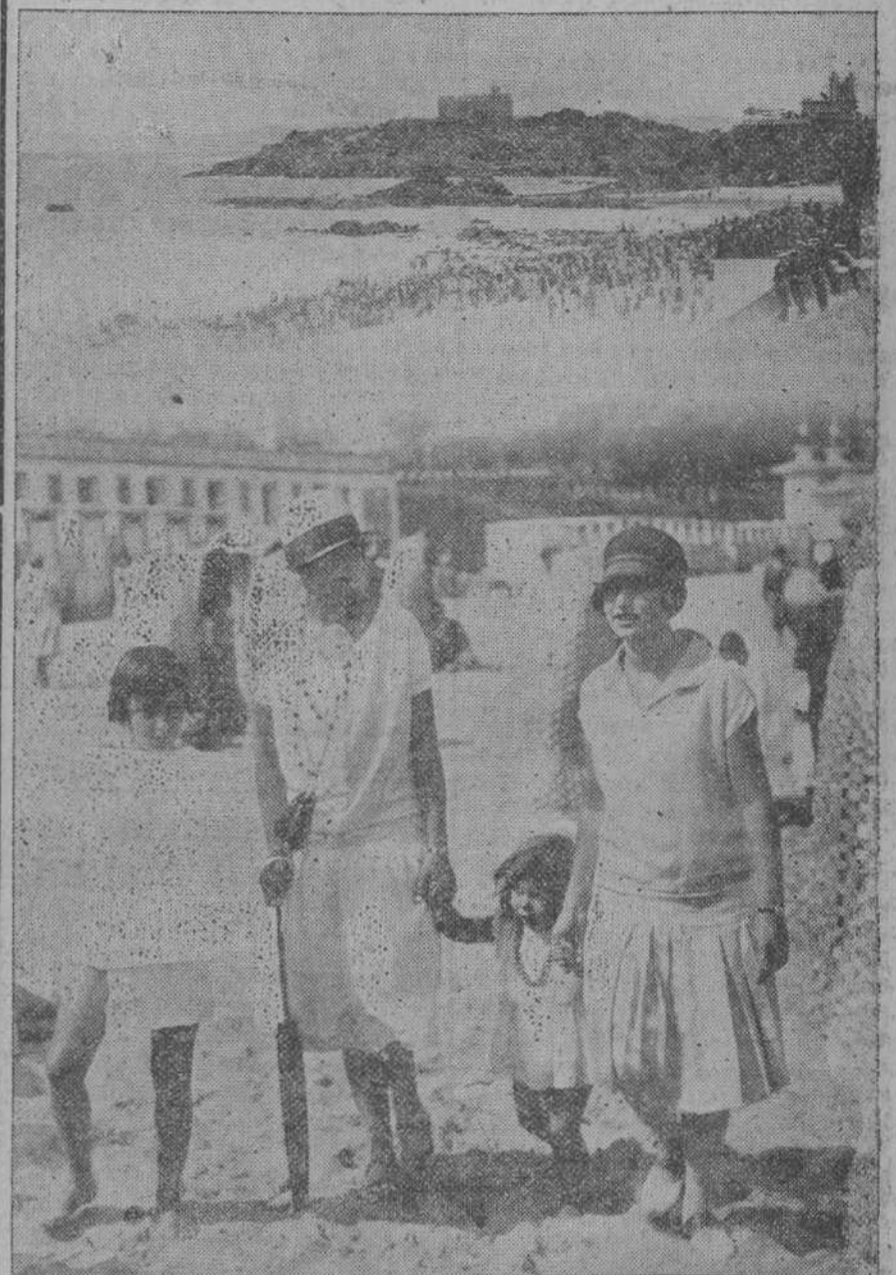
En estas calurosas mañanas de septiembre se ven por las playas—aunque no en la proporción que parece natural—bellas y elegantes señoritas y encantadores muchachos, que pasan alegremente las horas del baño.