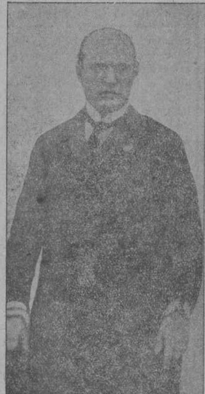
Benito Mussolini, jefe del Gobierno italiano, que ayer fué objeto de un atentado anarquista en Roma.