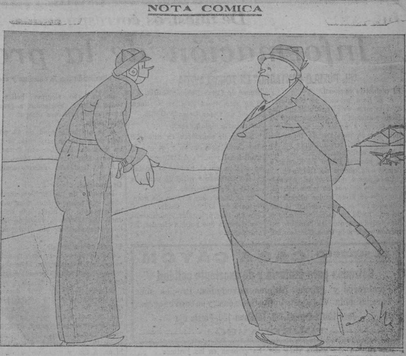
—EL GORDO.—¿Y usted cree que yo podría volar? EL AVIADOR.—¡ Hombre...! Según la cantidad de dinamita.