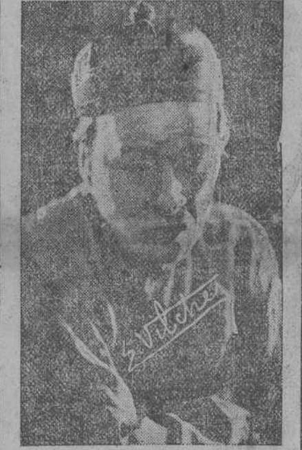
El gran actor Ernesto Vilches en la estupenda interpretación que hace del protagonista de «Wu-li-chang», obra con que debuta hoy en el Gran Casino.