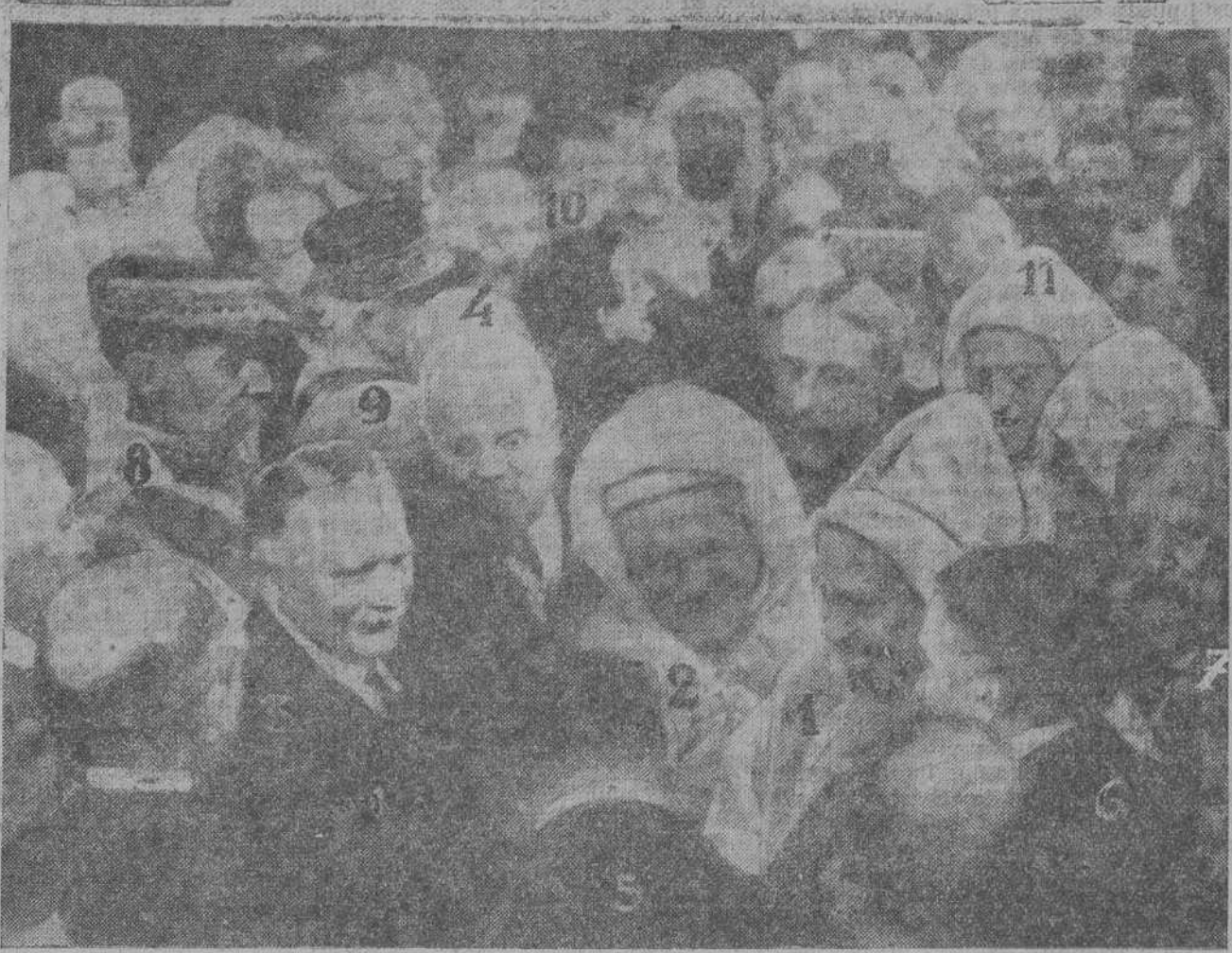
El presidente de la República francesa presenta los ministros al Sultán de Marruecos.—1, Muley Yusef; 2, Ben Ghabrit; 3, Doumeigue; 4, León Porrier; 5, Nogaro; 6, Briand; 7, Steag; 8, general Gourand; 9, Pétain; 10, Daniélou; 11, El Mokri.

Ha quedado establecida la comunicación de Gomara con Tetuán—Dice el alto comisario