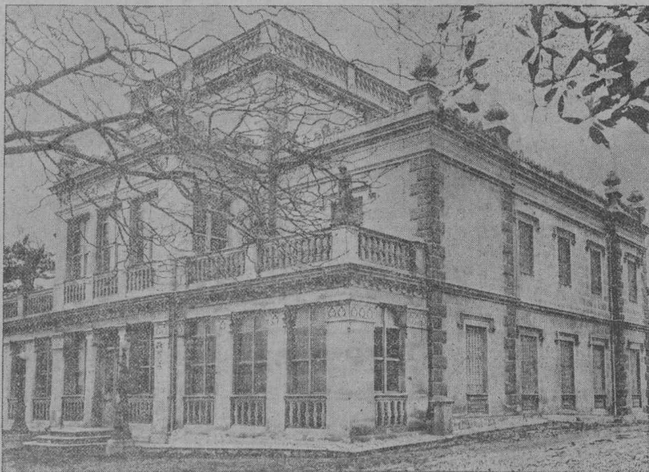
FINCA ADQUIRIDA PARA EL COLEGIO