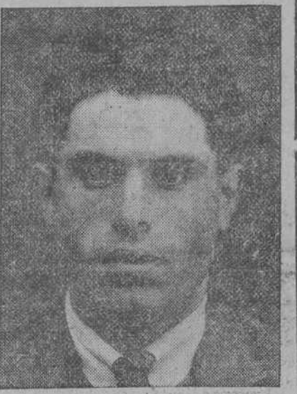
Buenaventura Durruti Domingo (a) «El Gorila», autor de los asaltos al Banco de España en Gijón y al Banco de la Habana y director del movimiento revolucionario en Vera del Bidasoa, detenido en París como complicado en el complot contra el Rey de España.

Ascaso tenía encima, además, un cheque de 1.000 pesetas contra un Banco italiano de París, un recibo acreditativo de la reciente compra de un automóvil de marca italiana y