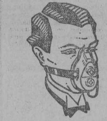
Portrait of a man in a suit, likely related to the 'Unapunta de cuchillo' advertisement.

participan al público que, para mayor facilidad en sus relaciones comerciales, han establecido una sucursal en la calle de Velasco, 8. En esta sucursal se venderán tanto los artículos de fabricación (mosaico, yeso, fregaderas, balaustradas y tubería), como los de almacén (cemento, cal hidráulica, azulejos, inodoros, etc.), en las mismas condiciones de economía que han vendido hasta ahora en la Fábrica y Almacenes de Astillero. Por contrato con la Sociedad Asturiana DURO FELGUERA, pueden vender el mejor carbón asturiano, sin que por ello aumente los precios corrientes, sirviéndole a domicilio en sacos freintados de 50 kilos, garantizándose el peso. Calle de Velasco, 8, Santander.— Fábrica y almacenes centrales: Astillero