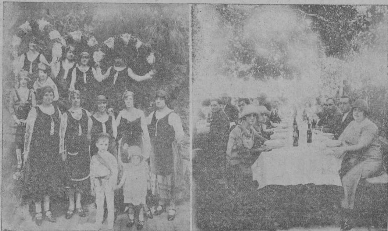
EN LA HABANA.—Distinguidas y bellas señoritas que vendieron avellanas, flores y rosquillas y postularon a beneficio del aguinado del soldado en la fiesta conmemorativa del Centro Montañés.—La mesa presidencial del banquete de confraternidad montañesa.

Refiriéndose a las obras que están llevándose a cabo por la Compañía de Teléfonos, dijo el alcalde que los santanderinos pueden estar completamente tranquilos, ya que todas las calles de la ciudad que han sido levantadas quedarán en perfectísimo estado una vez terminadas las obras.