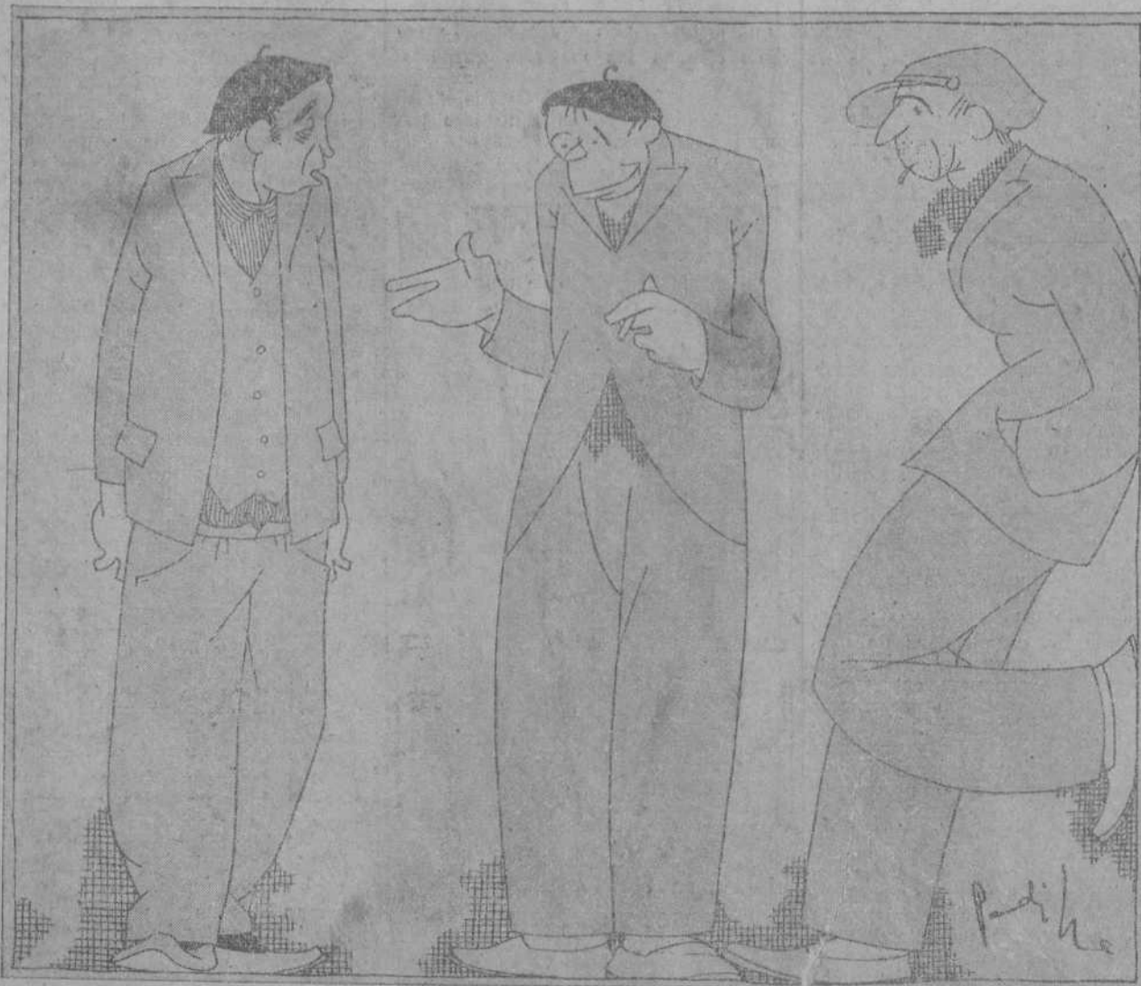
—Pues nada, que llegó la hora de las uvas, y me dije: Tú, Magunciano, déjate de detalles y tómalas en un bocado... Y total, que no pude pasar de la primera uva.