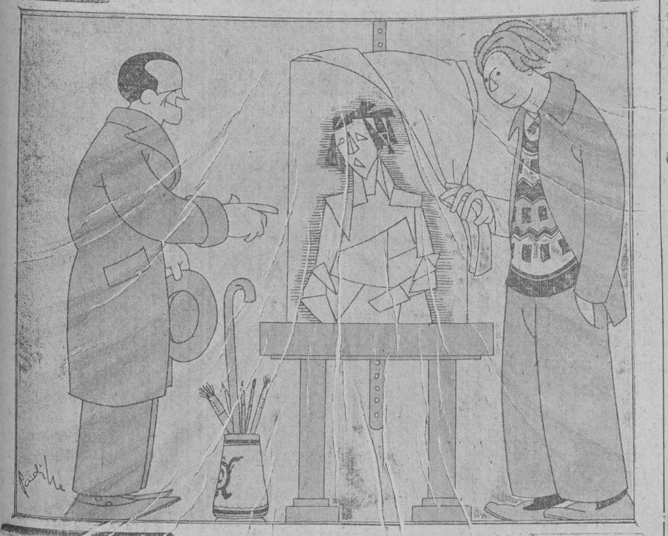
—Este retrato es el de mi novia. —¿Tú novia, todavía? ¿Después de esto?...