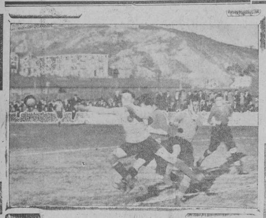
Una buena parada de Uriarte en el partido Eclipse-Muriedas, jugado el domingo en los Arenales.

Partido sosó y aburrido, en el que abundó el juego ilegal. Los racinguistas, que en el primer tiempo jugaron a favor de viento, no supieron sacar provecho de esa circunstancia, algo por la defensa cerrada que hicieron sus adversarios y