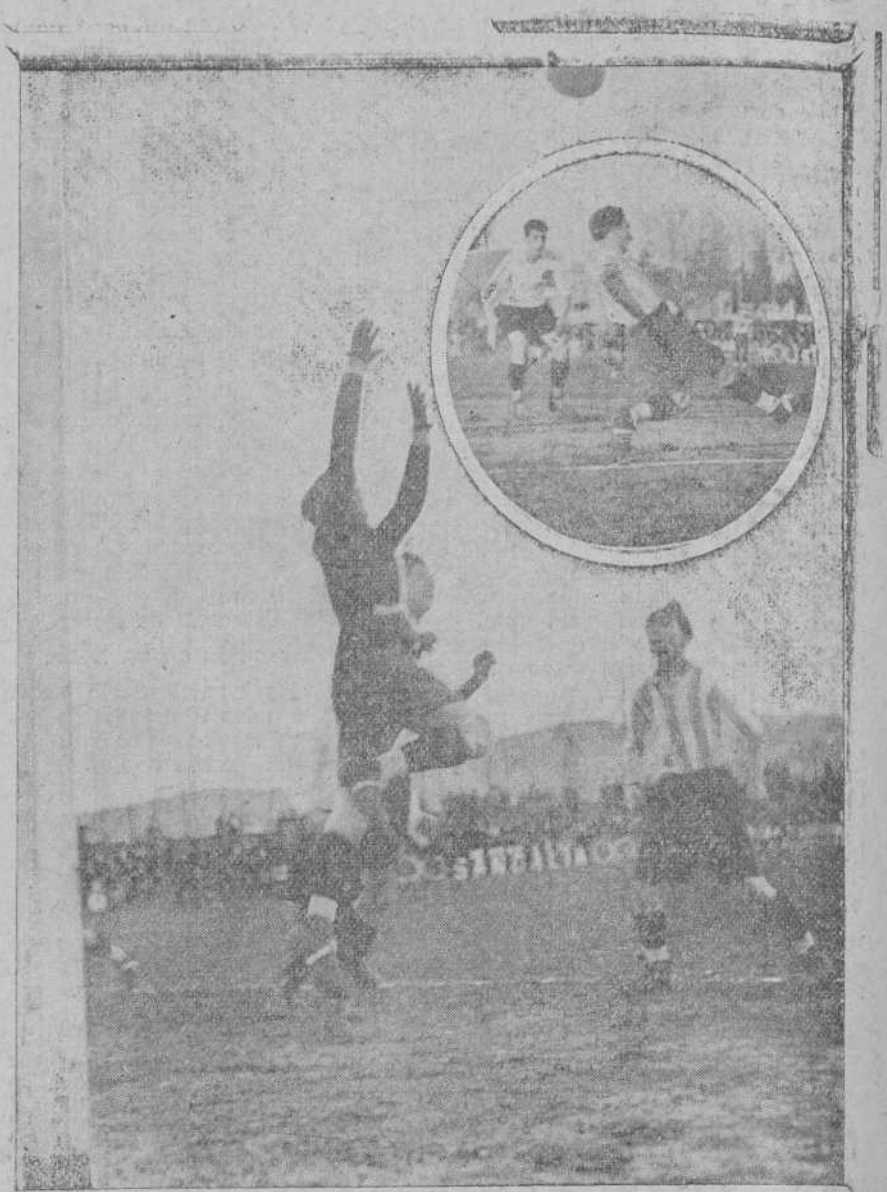
EN TORRELAVEGA.—Dos momentos del encuentro Racing-Gimnástica, celebrado el domingo. (Foto Samot).

guieron y tuvieron que retornar con las amarguras de la derrota.