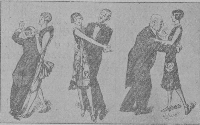
Un mismo «fox» es, sin embargo, completamente distinto. (Del «Punch», de Londres).