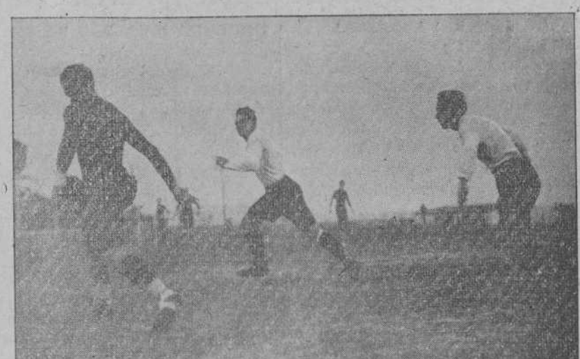
UNION MONTAÑESA-RACING CLUB B.—Colmer certa un avance de los racinguistas. (Foto SAMOT).

Si siguiendo la conducta que nos hemos trazado no queremos concluir esta reseña sin censurar los excesos