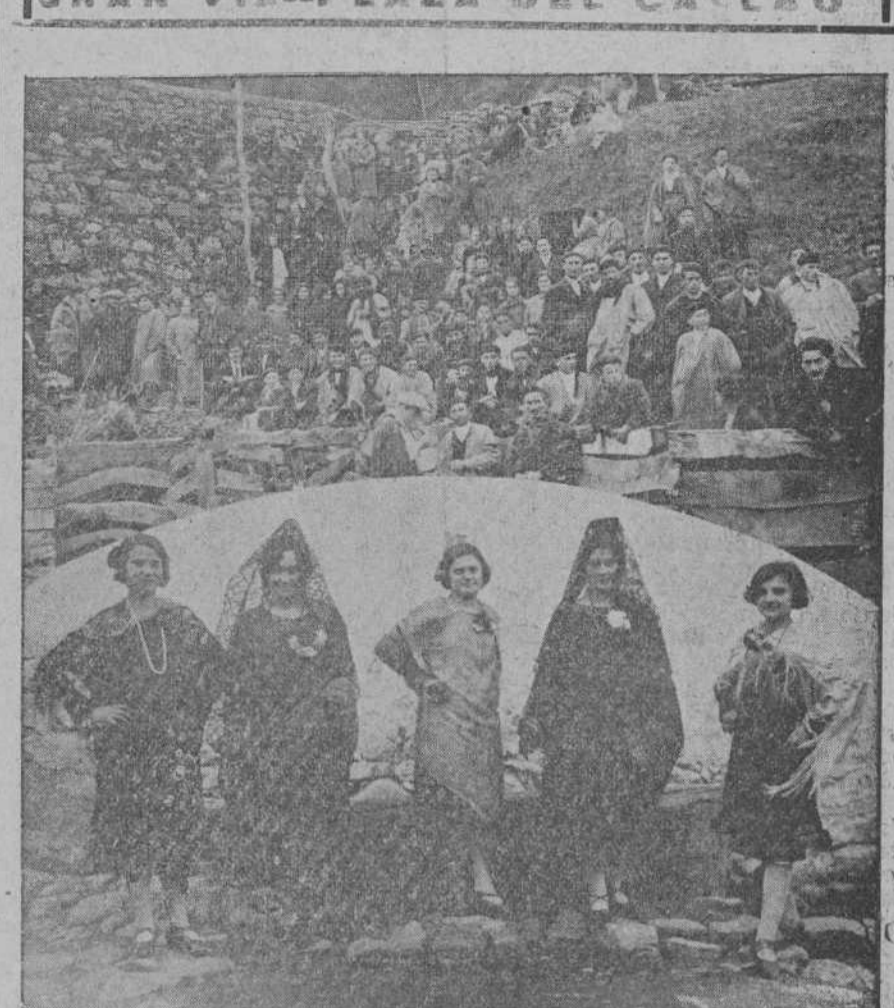
EN LUENA.—Aspecto de un tendido en la plaza de toros durante la celebración veraniega el domingo.—Bellas señoritas de la localidad que presidieron el festejo.