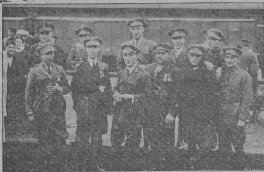
Grupo de oficiales del heroico batallón del infante.

Dijo que el acto de hacerle depositario de las actas en las que se le nombra hijo adoptivo, no sólo de la