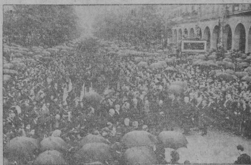
EL RECIBIMIENTO DEL BATALLÓN DEL INFANTE EN ZARAGOZA. Aspecto que ofrecen el paseo de la Independencia y la plaza de la Constitución durante el minuto de silencio en honor de los muertos en la campaña de Marruecos. (Foto Palacios.—Zaragoza).