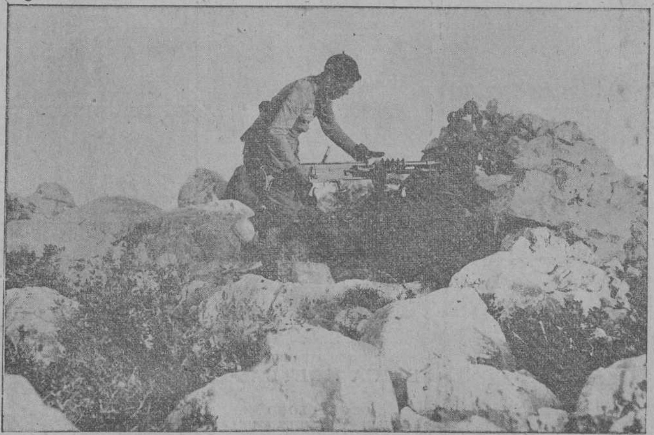
Un nido de ametralladoras españolas en Morro Nuevo.