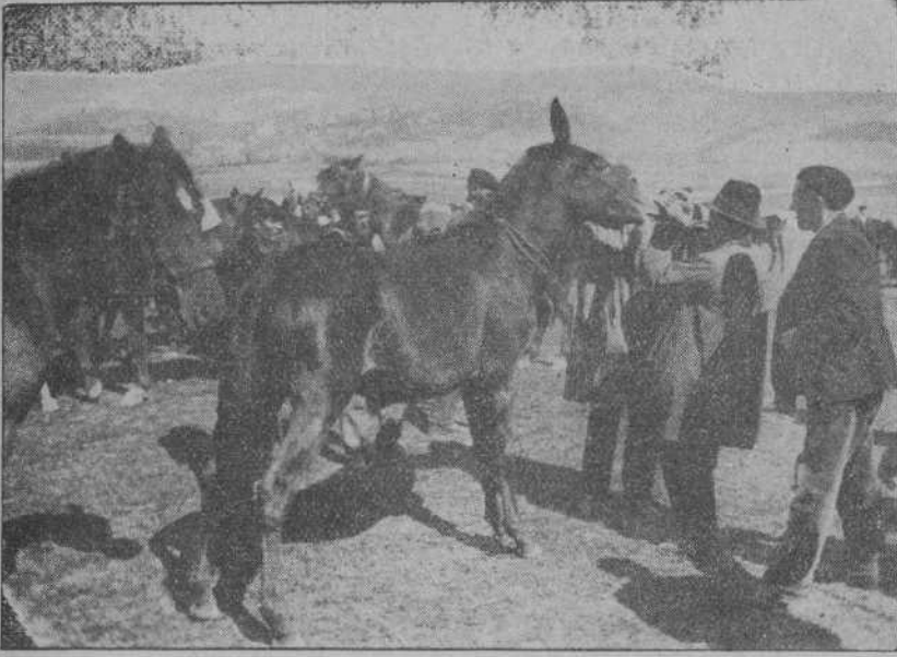
ESCENAS DEL MERCADO DE REINOSA.—RECONOCIENDO A UN BUEN EJEMPLAR.