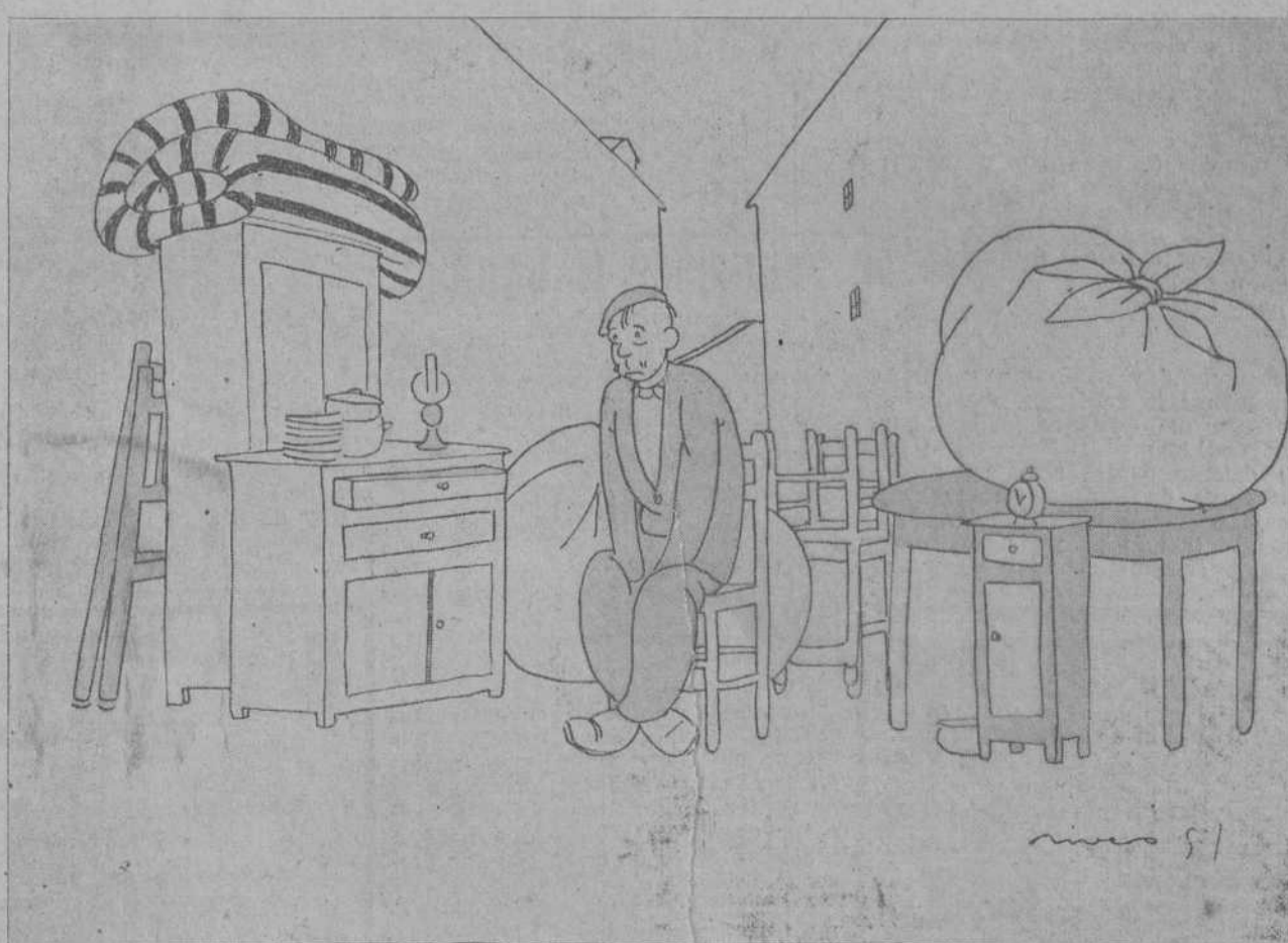
Mi «parienta» es terrible. Cuando sale a la calle no se acuerda de volver a casa.