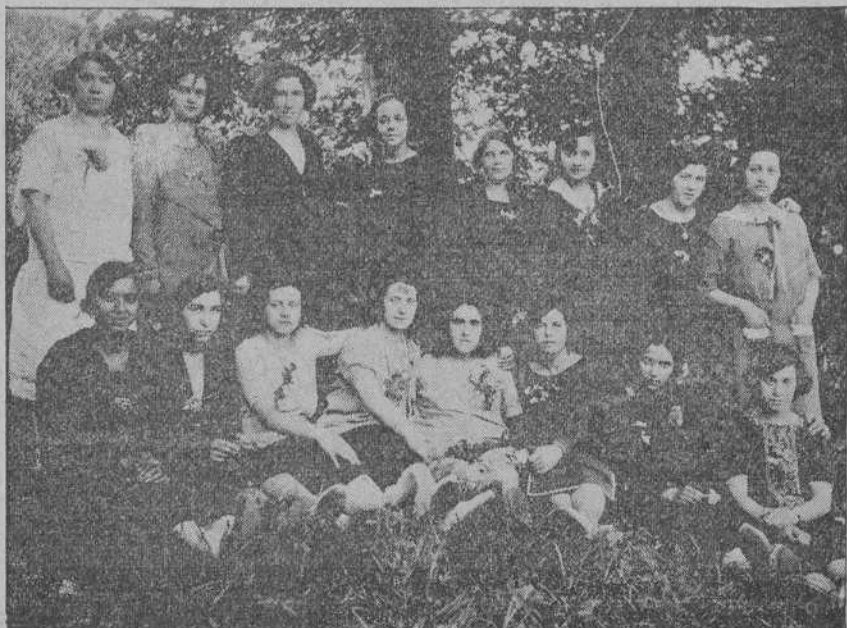
Grupo de simpáticas chicas, del Sindicato de la Inmaculada de Costureras, que recientemente hicieron una excursión a Puente San Miguel.

SEVILLA, 4.—En el cortijo de Los Merinales se celebró una fiesta benéfica, a la que asistieron los infantes y numerosos invitados. Se lidiaron dos becerros, que fueron toreados admirablemente por Belmonte y Sánchez Mejías, que entusiasmaron a la concurrencia. La fiesta era a beneficio de la Hermandad del Rocío.