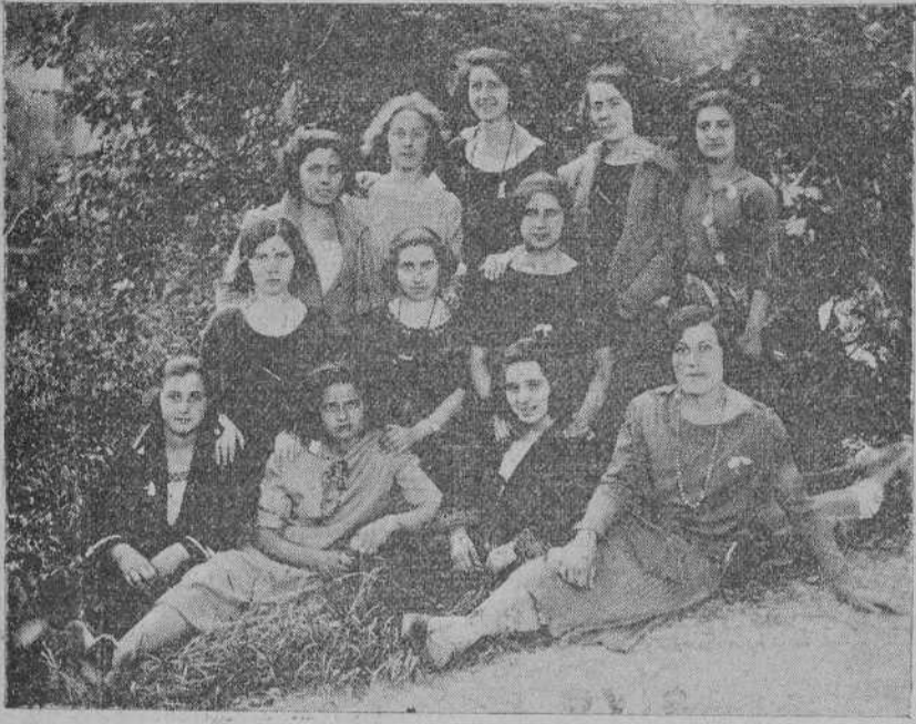
Algunas de las bellas jóvenes pertenecientes al Sindicato de la Inmaculada de Costureras que, en animada excursión, fueron al pintoresco pueblo de Puente San Miguel.