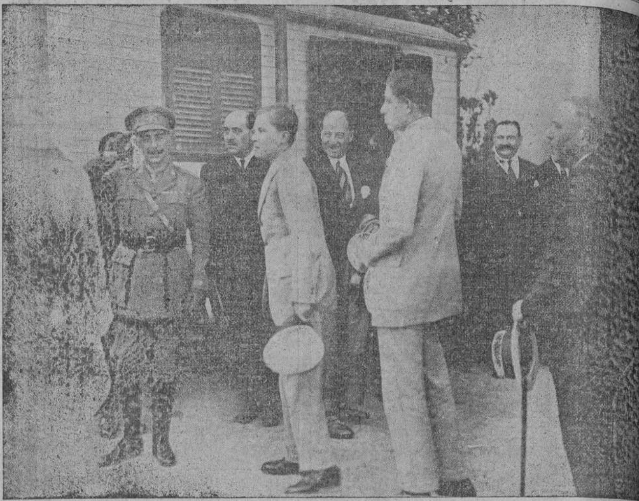
El príncipe de Asturias y sus augutos hermanos al entrar ayer tarde al Circo. Palisse, donde sus Altas pasaron agradablemente unas horas presenciando tan notable espectáculo.