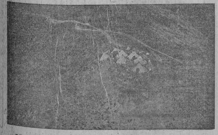
DE LA ZONA ORIENTAL.—Vista, tomada desde un aeroplano, de una de nuestras posiciones avanzadas.