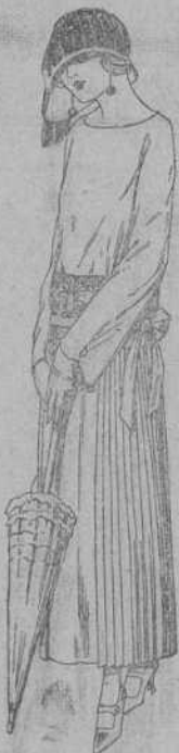
Vestidos de sarga inglesa, popeline, etc., en negro, azul y color, adornos bordados a mano. A ptas. 110.