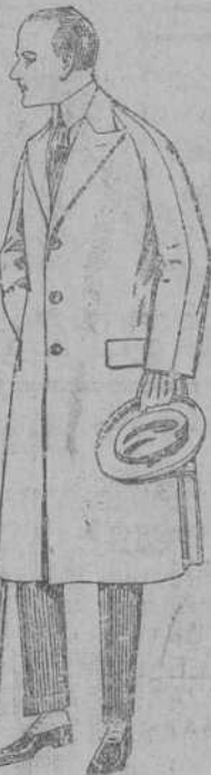
Gabanes de melton, gabardina, etc. De pesetas 75 a 180.