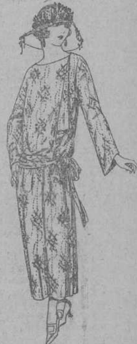
Vestidos de velo de algodón, dibujos novedad A pesetas 50.