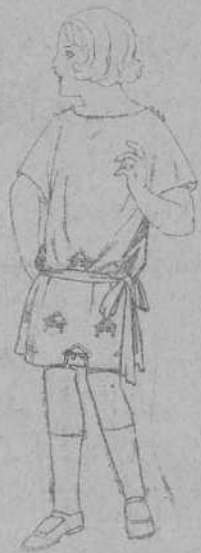
Vestidos popeline, sarga inglesa, etc., adornos bordados, para niñas de 4 a 9 años de ptas. 30 a 35

Ropas confeccionadas para Caballero, Señora, Niño y Niña.