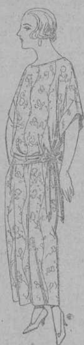
Batas de crespón, en negro y colores, adornos bordados. De pesetas 32 a 38.