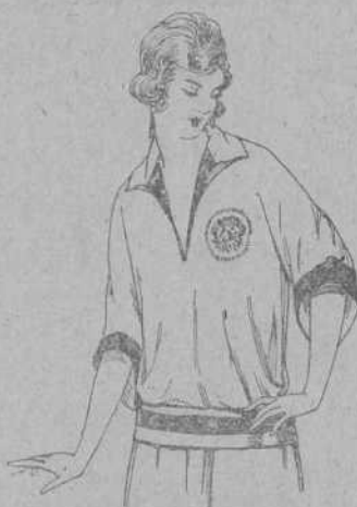
Blusas tricot de seda, en negro y colores moda. A pesetas 39.