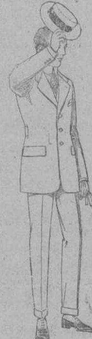
Trajes modelo Sport, de lanilla, melton, etc. De ptas. 75 a 100.