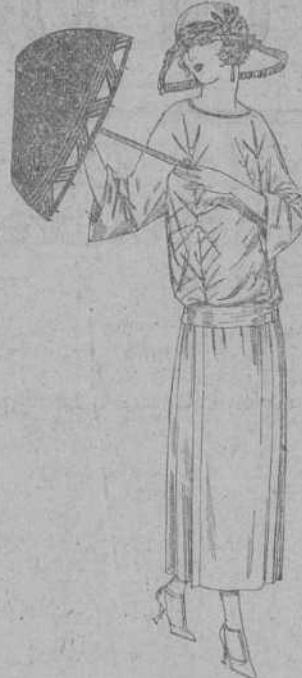
Vestidos de tricot de seda, en negro, azul y colores moda, adornos bordados. A pesetas 115.