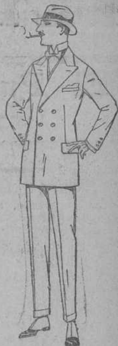
Trajes de lanilla, melton, estambre, vicuña o jerga. De ptas. 40 a 140.