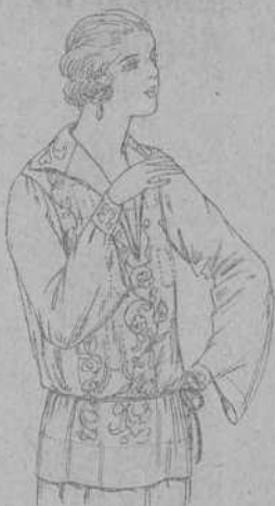
Blusas de voile de seda, en negro y blanco, adornos bordados. A ptas. 22