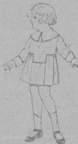
Vestidos batista blanca, pespunte de adorno para niñas de 3 a 6 años. De pesetas 5,50 a 6,50.

Ropas confeccionadas para Caballero, Señora, Niño y Niña.