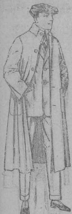
Guardapolvos de dril, igual al modelo. De ptas. 12 a 20.

Sucursales: Madrid, Barcelona, Alicante, Almería, Bilbao, Cádiz, Cartagena, Gijón, Granada, Málaga, Palma de Mallorca, Santander, Sevilla, Valencia, Valladolid, Zaragoza.