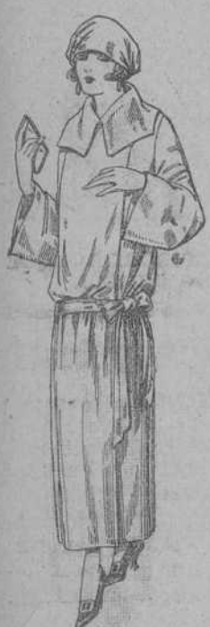
Guardapolvos de dril crudo, gris, beig, etc. De ptas. 18 a 25.