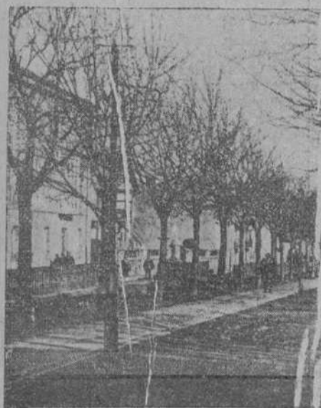
REINOSA.—PASEO DE CUPIDO

Las anheladas ferias pasarán con su farrago mundano, sin otro interés que el verdaderamente mercantil. En este aspecto seguirán siendo muy importantes, llamando con brío a la bolsa avara de los negocios.