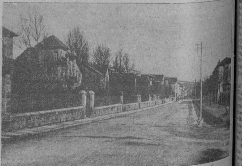
REINOSA.—AVENIDA DEL DOCTOR CANTOLLA

El señor Alonso «sabra» por nosotros el elogio que de él y sus productos hacemos, en gran medida nuestra sinceridad, obligada a manifestarlo de manifiesto lo dicho al ocuparse de la gran industria reinosana.