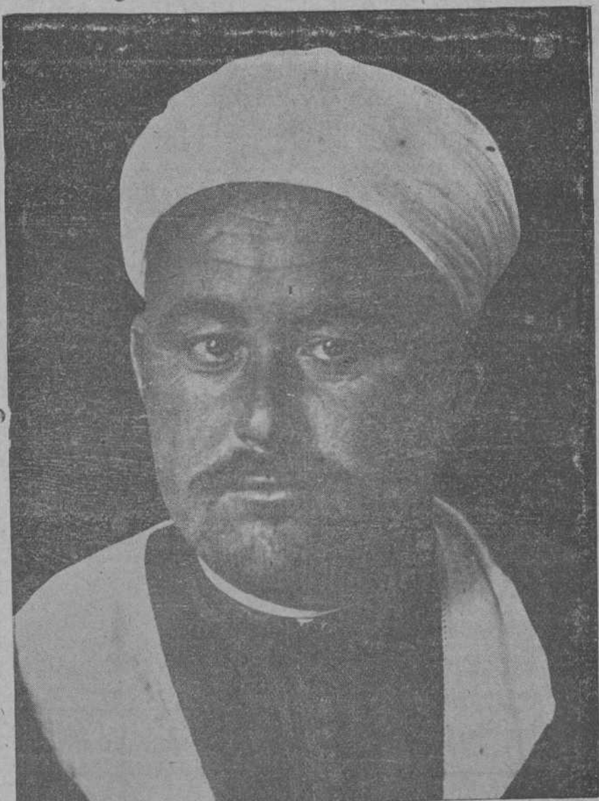
EL JEFE MORO ABD-EL KRIM, CUYA PETICION DE PAZ A ESPAÑA ESTA SIENDO OBJETO DE TANTOS COMENTARIOS

Añadían que el ex sultán había venido a acortar las distancias y que