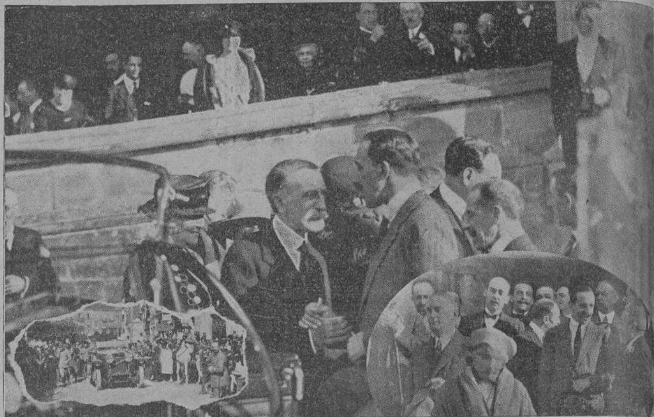
DE LA EXCURSION A COMILLAS.—Su Majestad el Rey conversando con el marqués de Comillas en el palacio de éste.—En los ángulos, el paso de la caravana por Torrelavega y Sus Majestades y el señor Alvear saliendo del palacio del marqués.