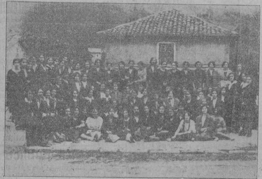
UNA EXCURSION A PUENTE VIESGO.— Grupo de jóvenes del Sindicato de la «Inmaculada de Costurera» durante la fiesta.

MADRID, 20.—A las diez y media de esta mañana se ha celebrado una misa en la capilla de Palacio con motivo de celebrar su cumpleaños el infante don Juan, hijo de los Reyes.