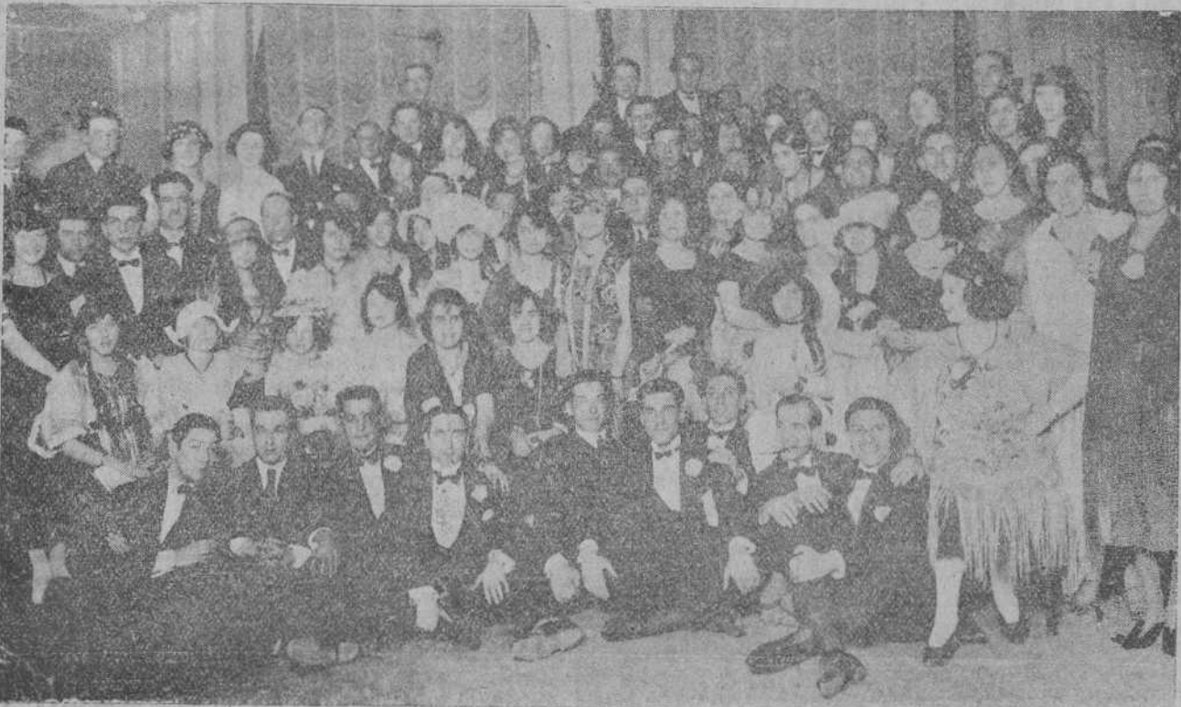
EN BARREDA.—Grupo de concurrentes al baile de trajes, verificado en el Casino.

En cuanto a Casanellas dijo que había dificultades para detenerlo, pero es posible que ocurra lo mismo con Casanella y que el día monos posiblemente sea detenido.