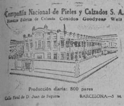
Compañía Nacional de Piel y Calzados S. A. Fábrica de Calzado Costados Goodyear Welt. Producción diaria: 800 pares. Calle Real de D. Juan de Pezuela. BARCELONA—S. M.