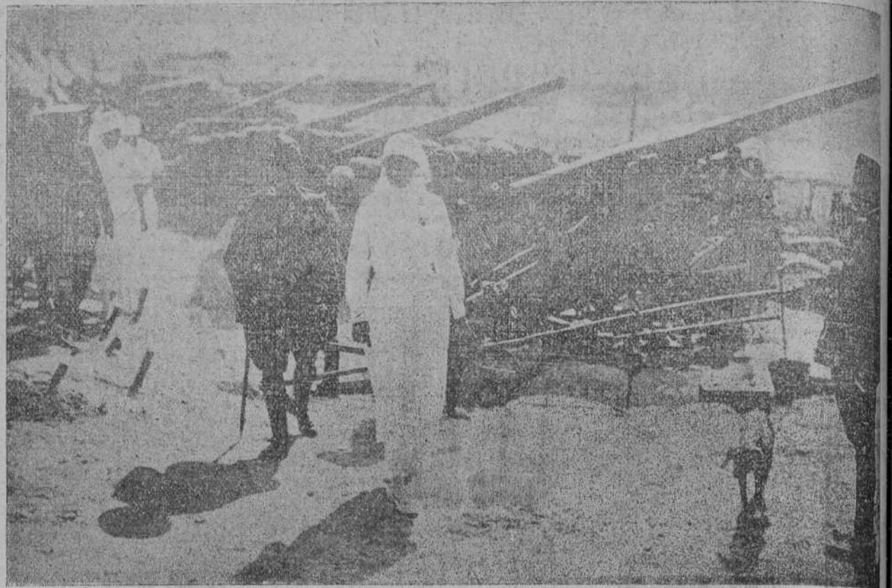
MARRUECOS.—La infanta doña Luisa recorriendo las fortificaciones del zoco del Hach.

Con la pérdida del «Marianela», uno de los mejores buques de la matrícula santanderina, sufre ésta una disminución en su tonelaje, que lamentarán todos los montañeses.