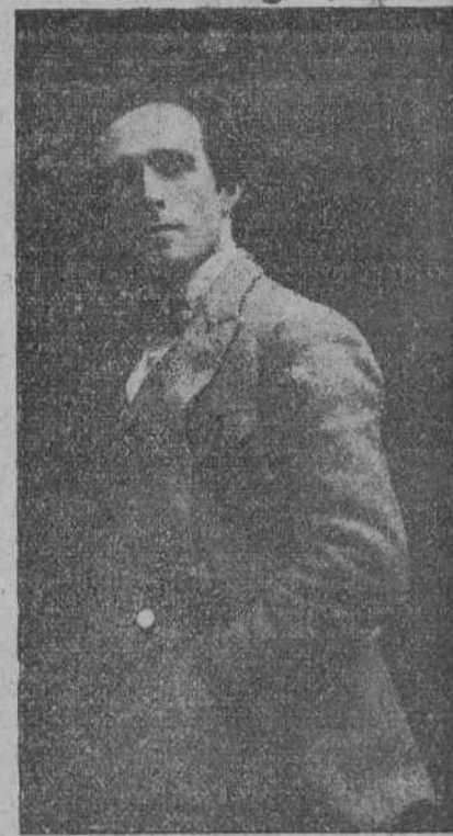
EL NOTABLE TENOR ESPAÑOL, JESUS GABRIA, QUE ESTA TARDE CANTA EN EL TEATRO PEREDA «LA FANCIULLA DEL WEST».

Sin que nosotros sepamos de quienes ven arrebatados y péñanos de covinitas y hasta pontes y valles en la famosa "Pastoral" del mago Beethoven, no por ello dejamos de ver a veces algún clarísimo reflejo de lo que pasa en la mente de los personajes de una obra lírica, por medio de un tema acertadamente expresado. Así nos ocurre con el tema del amor en la muerte, manifestado en el colosal dúo del acto segundo con una exaltación de la música realmente deslumbradora y que reapare-