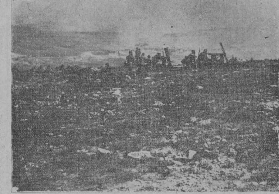
MELILLA.—Las empujadoras funcionan en la protección de un con- voy.

En 1664 se dispuso que todos los años se despatcharan, con viaje de ida y vuelta, cuatro «avisos», dos a