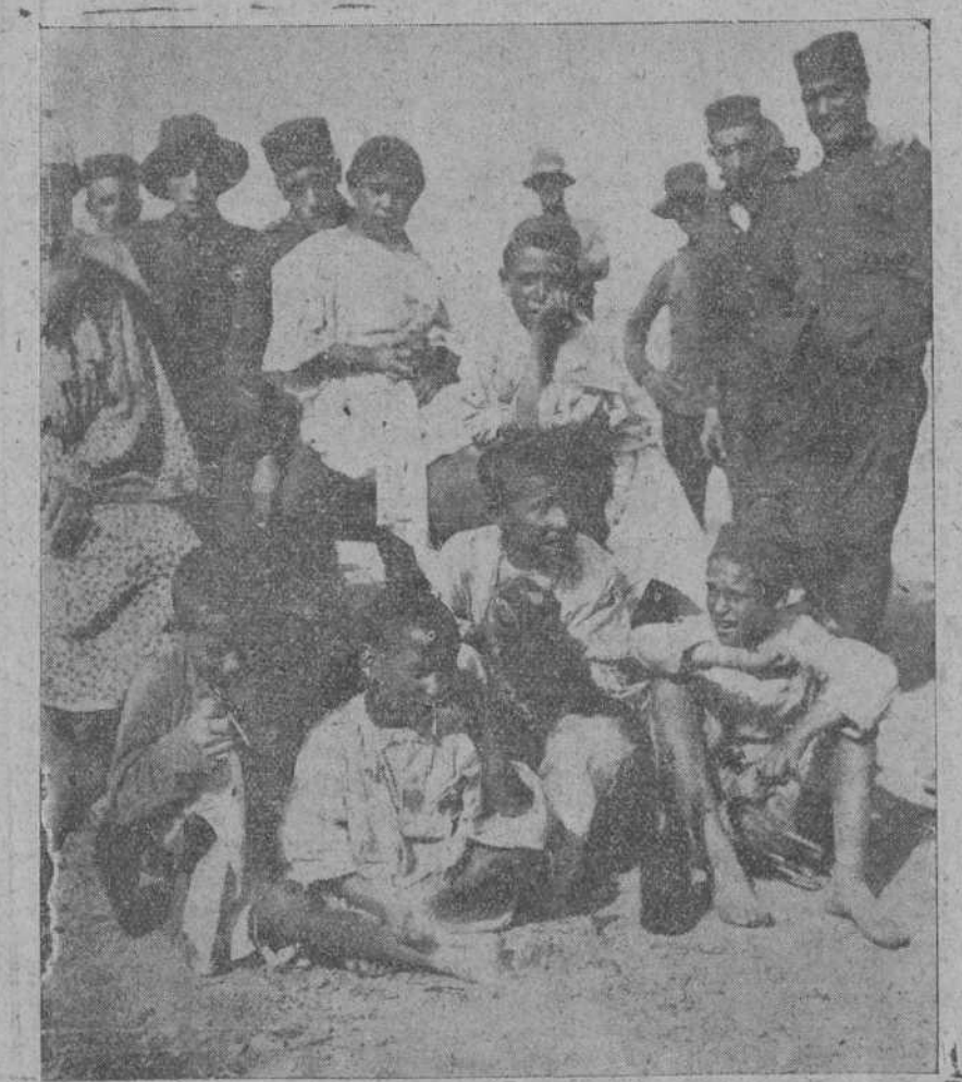
MELILLA.—Grupo de moritos y soldados de Valencia en el campamento.

PARA LA SUSCRIPCION PATRIOTICA : : : : En el Gobierno civil se recibieron ayer los siguientes donativos, con des-