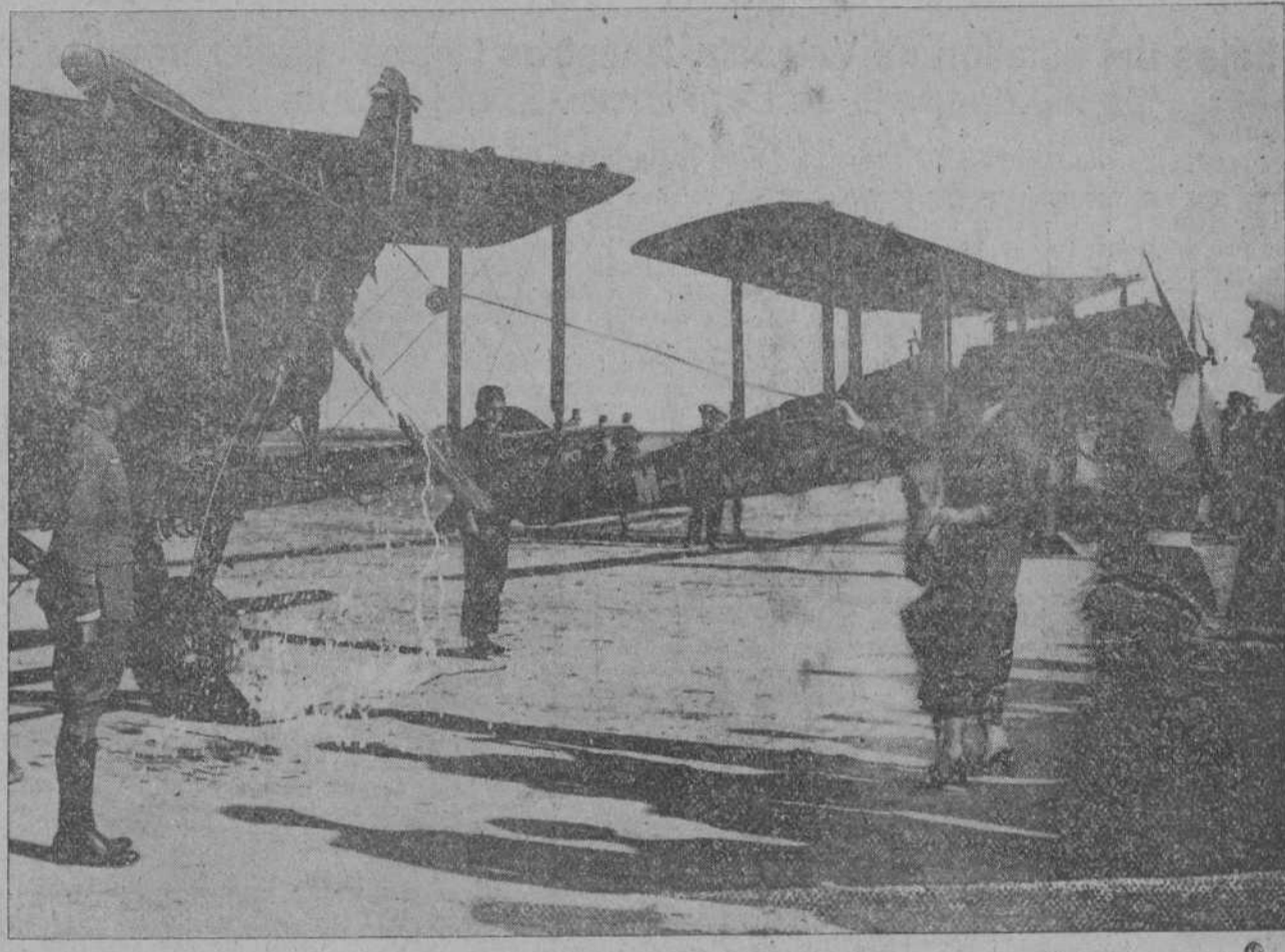
MADRID.—Su Majestad la Reina, madre del «Salamanca número 1», en el momento de romper la botella de champagne en el acto del bautizo de los aeroplanos. (Foto. Vidal-Madrid).