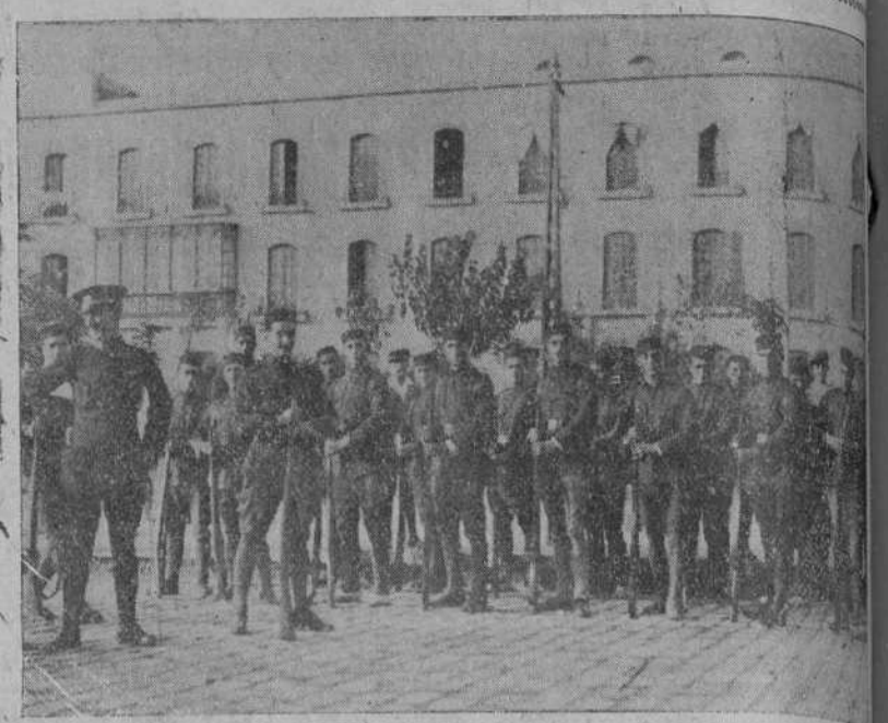
EN ALERÍA, EL PATALON DE VALENCIA EN DESPLAZO DURANTE LOS EJERCICIOS DE INSTRUCCION.

En Madrid: Kiosco de «El Debate», calle de Alcalá. En Bilbao: En la librería de Teófilo Cámara, Alameda de Mazarredo, y en el kiosco de la estación de Santander. En Burgos: En el kiosco de Ursino Bartolomé, Paseo del Espolón (Teatro).