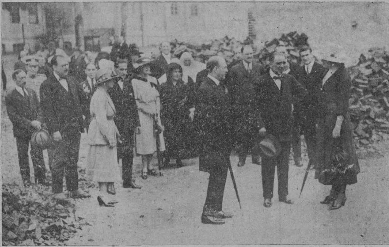
EN EL ASILO DE LA CARIDAD.—Su Majestad la Reina enterándose del estado de las obras del nuevo pabellón.

El carácter eventual, como impuesto por las circunstancias.