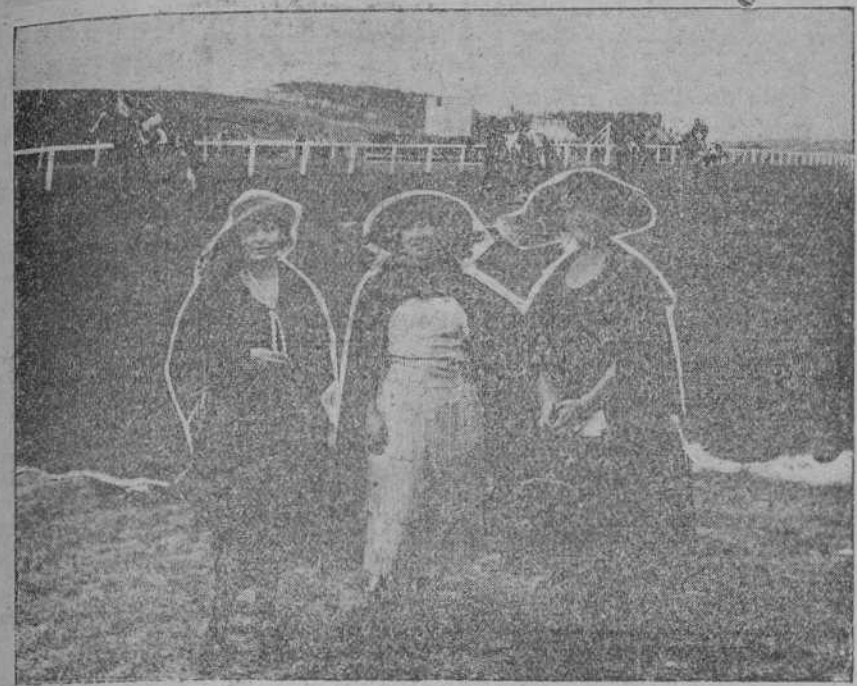
DE LAS CARRERAS DEL DOMINGO.—Figuras del stand.—Un momento en la carrera del Gran Premio.