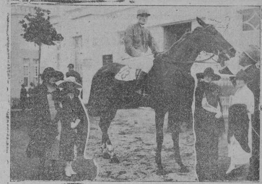
DE LAS CARRERAS DEL DOMINGO.—El caballo «Ma Blonde», ganador del Gran Premio.—Algunas bellas concurrentes al stand.

Per sacudir alfombras: La Guardia municipal denunció ayer a los inquilinos del piso tercer de la casa número 17 del paseo de Pereda por sacudir alfombras después de la hora permitida por las Ordenanzas.