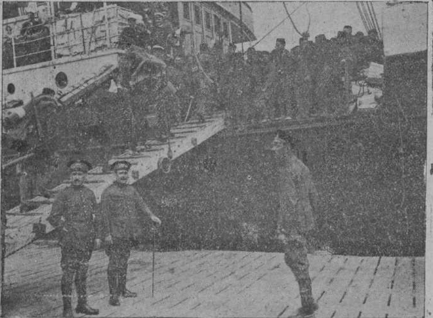
LA MARCHA DEL REGIMIENTO DE ANDALUCIA.—Momento de pasar a bordo las tropas expedicionarias.

A consecuencia del accidente resultaron algunos viajeros heridos de gravedad.