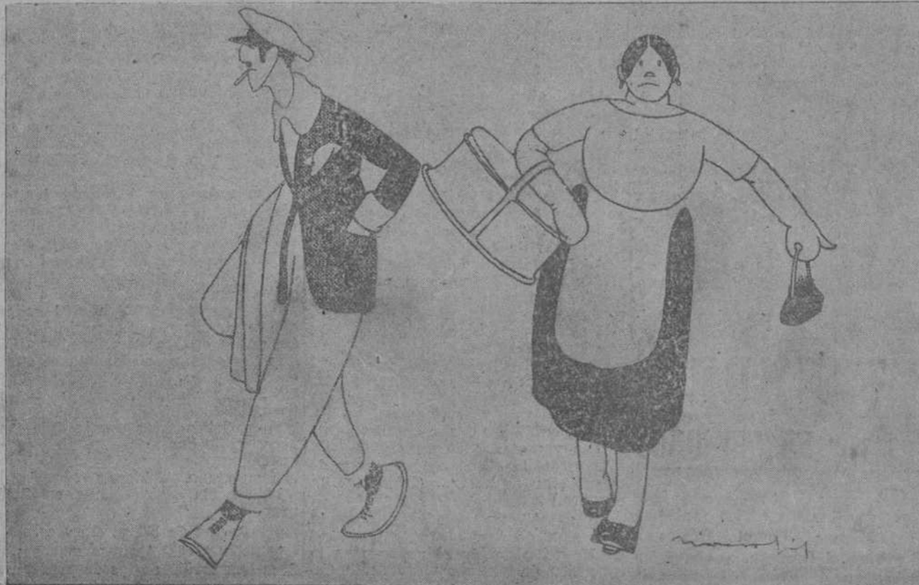
LOS QUE REGATEAN.