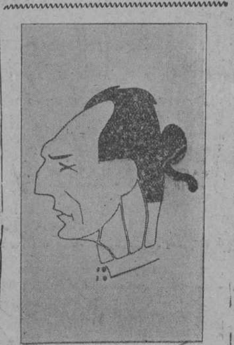
SÁNCHEZ MEJÍAS.