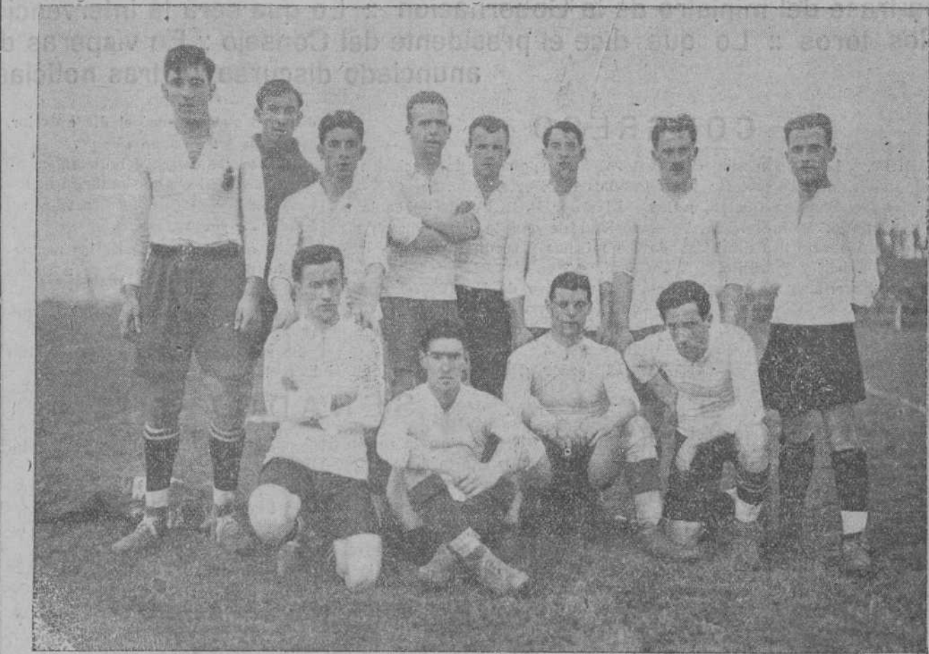
EL EQUIPO DEL «REAL UNIC N.º 1» DE IRUN, QUE MAÑANA JUGARÁ UN PARTIDO CON EL RACING EN LOS CAMPOS DE SPORT.