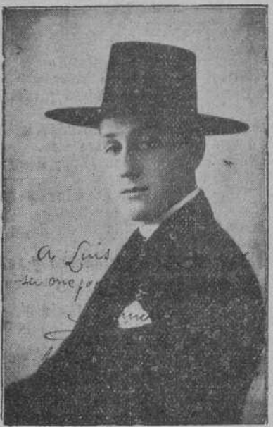
EL DIESTRO MANUEL GRANERO, COGIDO AYER TARDE POR UN TORO DE SALAS EN LA PLAZA DE MADRID.

La correspondencia política y literaria dirija a nombre del Director. APARTADO DE CORREOS 67.