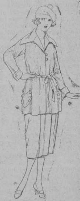
Paletots de tricot de seda, en negro, azul y color. De ptas. 55 a 198.