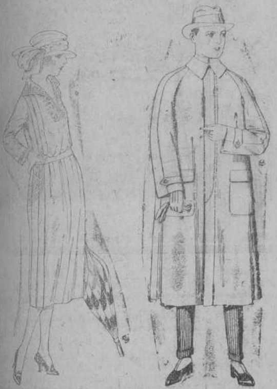
Vestidos de gabardina, sarga inglesa, etc., en negro, azul y color, adornos bordados. De ptas. 110 a 130.