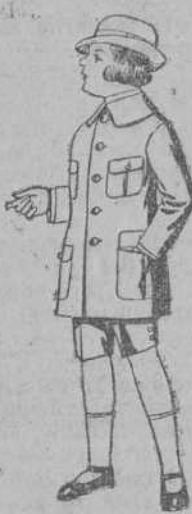
Trajes modelo Sport, de lanilla, estambre, melton, etc., para niños de 7 a 12 años, de ptas. 28 a 50. Trajes de dril crudo o kaki, para niños de 3 a 7 años, de ptas. 9 a 15.