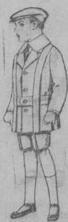
Trajes modelo Sport, de lanilla, estambre, melton, etc., para niños de 4 a 9 años, de ptas. 30 a 48. Trajes de dril liso o listado, de ptas. 9 a 18.