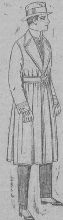
Gabanes impermeabilizados con cinturón «American trench coat». De ptas. 200 a 350.

PRECIO FIJO :: VENTAS AL CONTADO PIDASE EL CATALOGO GENERAL