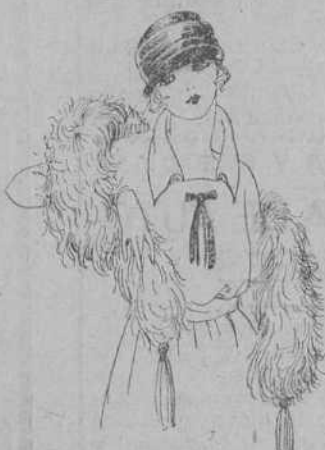
Boas de plumas avestruz, gran variedad en colores y tamaños, de ptas. 15 a 125. Gran surtido en capelinas de marabú, de ptas. 30 a 70.