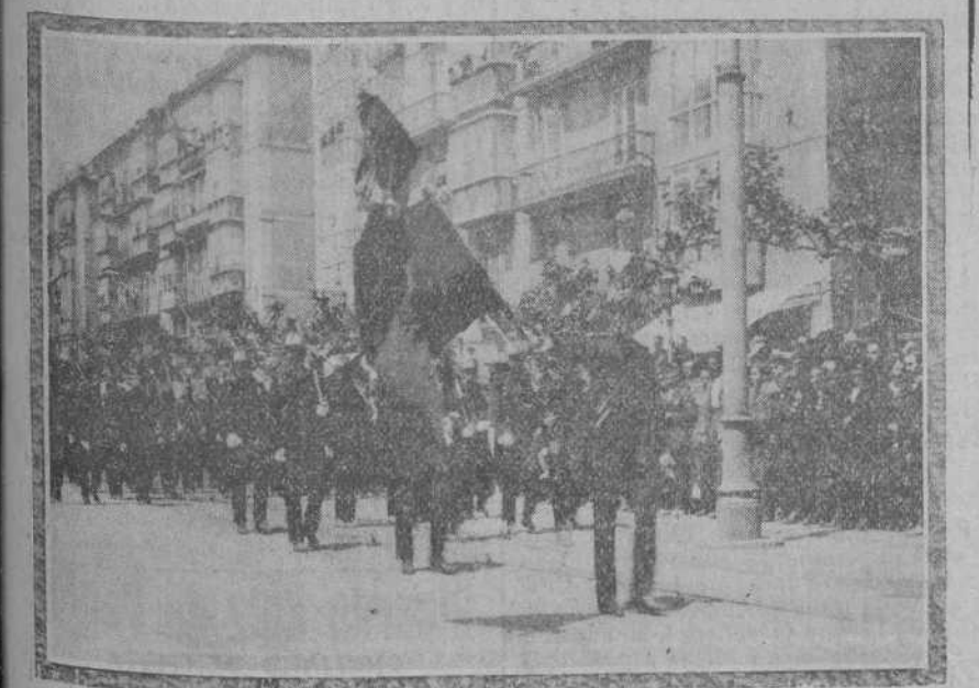
La bandera del regimiento de Valencia al pasar frente a las autoridades durante el desfile verificado el domingo.

Toda la correspondencia administrativa, consultas sobre anuncios y suscripciones, dirijanse al administrador, apartado de Correos