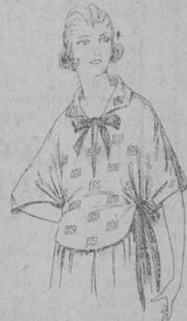
Blusas de crepón de seda, voile y etamin estampado, de ptas. 4 a 25.