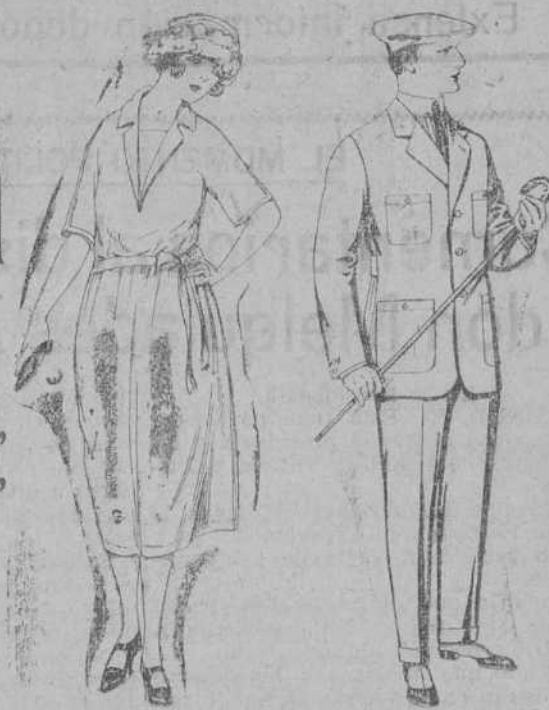
Vestidos de punto de seda, en negro, azul y color. De ptas. 181 a 230.