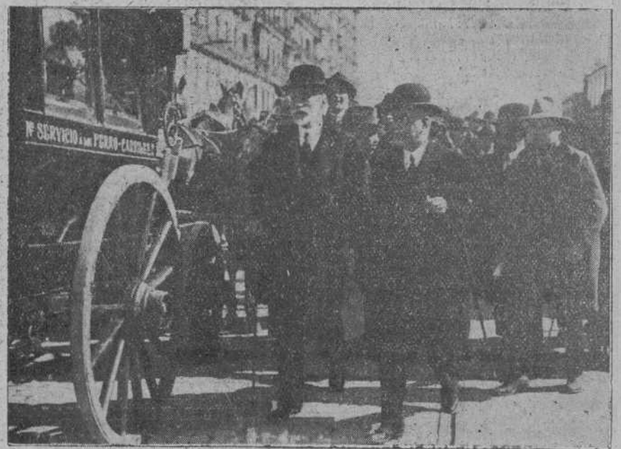
Don Antonio Maura por la calle de Alcalá, al dirigirse al domicilio del señor Dato, seguido del público, que le ovacionó.