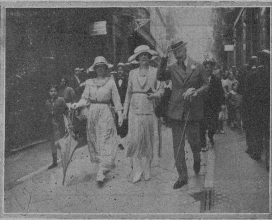
SU MAJESTAD LA REINA, LA PRINCESA ALICIA DE ALBANY Y SU ESPOSO, EL BARON DE ALTHONE, PASEANDO ANTEAYER POR LA CALLE DE LA BLANCA.