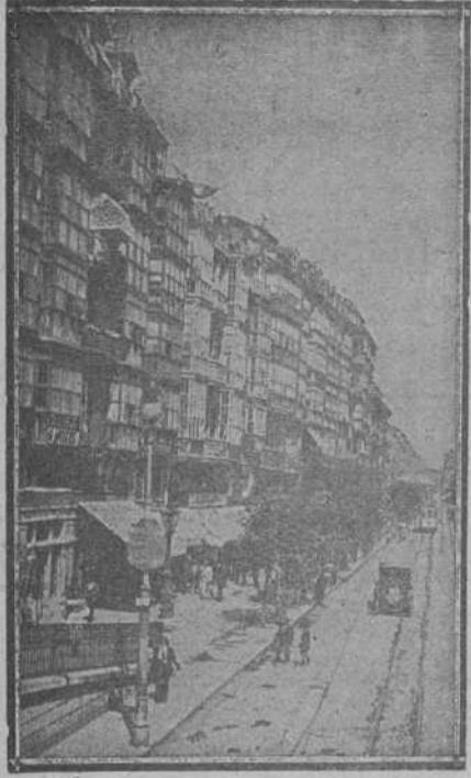
CALLE DE LA RIBERA