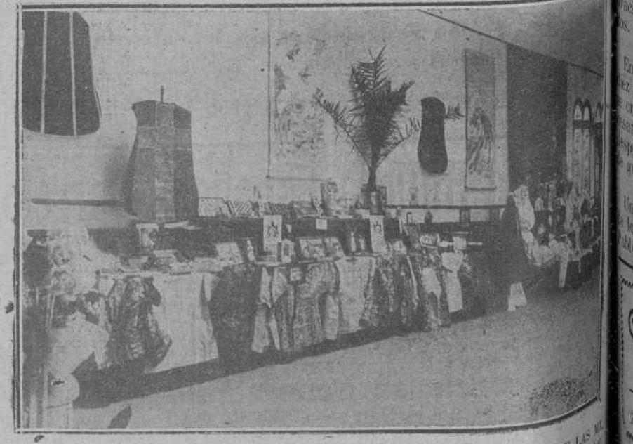
UN DETALLE DE LA MAGNIFICA EXPOSICION QUE LAS SEÑORITAS DE LAS MISIONES TIENE INSTALADA EN LA RESIDENCIA DE LOS JESUITAS